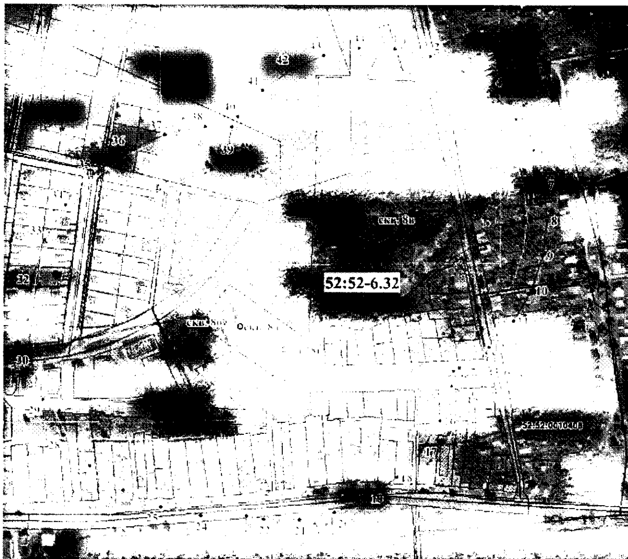
Координаты характерных точек границ второго пояса ЗСО скважин №№ 8а, 8б, 8в, 8г водозабора Антоповского участка Южно- Горьковского месторождения в г.о.г. Выкса Нижегородской области