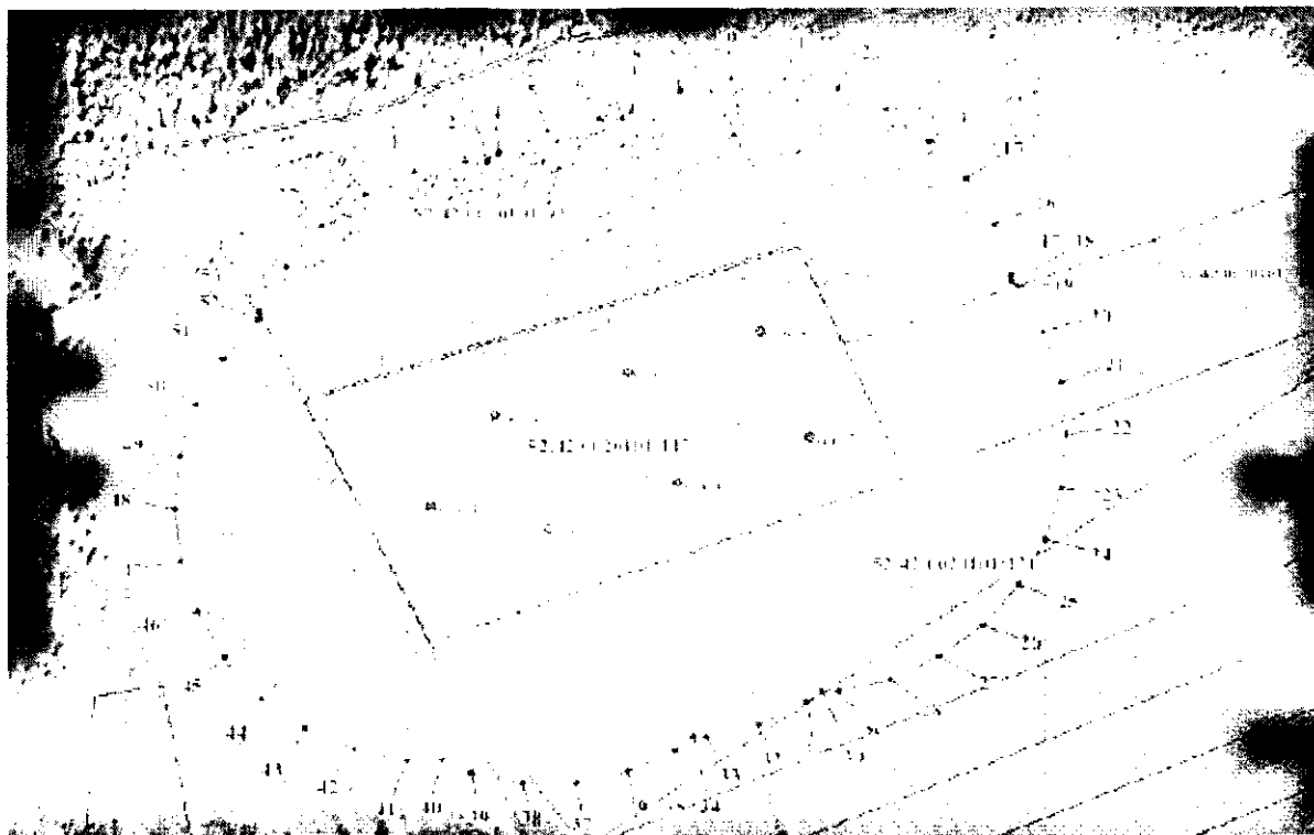
Координаты характерных точек границы второго пояса ЗСО водозаборного участка

2. Граница второго пояса ЗСО проектируемого водозаборного участка, состоящего из скважин №№ 1 – 7, устанавливается единой - по внешним дугам пересекающихся окружностей радиусом 187,0 м от устья каждой скважины.