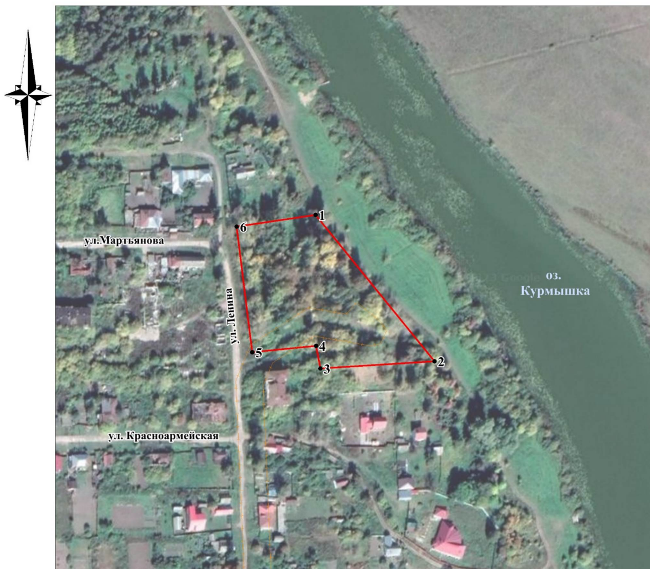
СХЕМА ГРАНИЦ ПАМЯТНИКА ПРИРОДЫ РЕГИОНАЛЬНОГО ЗНАЧЕНИЯ "ПУШКИНСКИЙ САД" С. КУРМЫШ"

Приложение 2 к паспорту на памятник природы регионального значения "Пушкинский сад" с. Курмыш", расположенный в Пильнинском муниципальном округе Нижегородской области