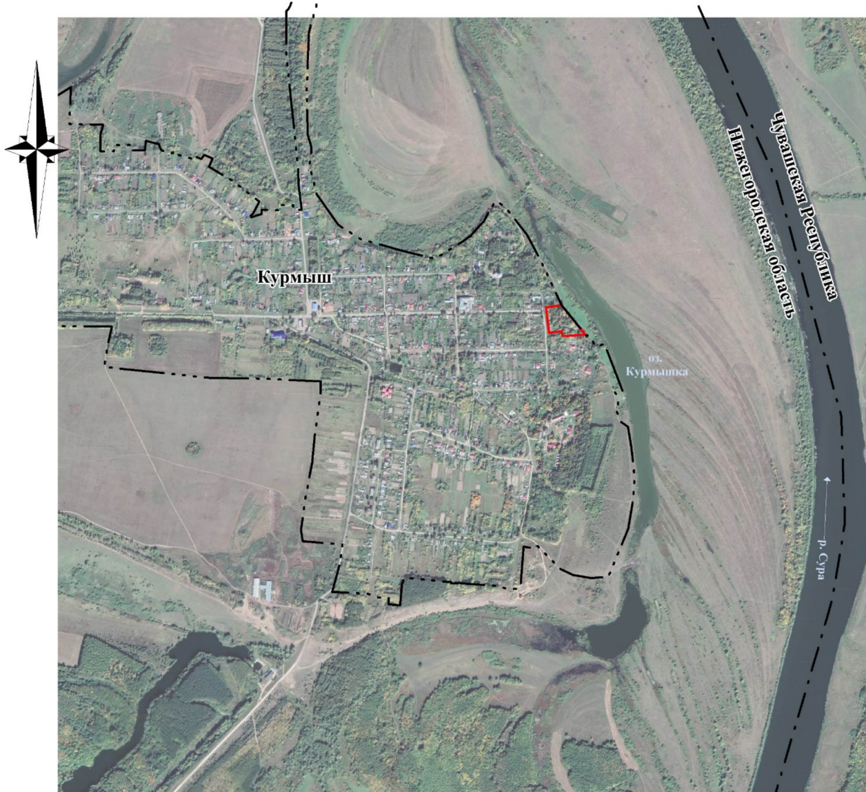
СХЕМА ГРАНИЦ ПАМЯТНИКА ПРИРОДЫ РЕГИОНАЛЬНОГО ЗНАЧЕНИЯ "ПУШКИНСКИЙ САД" С. КУРМЫШ"

Приложение 1 к паспорту на памятник природы регионального значения "Пушкинский сад" с. Курмыш", расположенный в Пильнинском муниципальном округе Нижегородской области