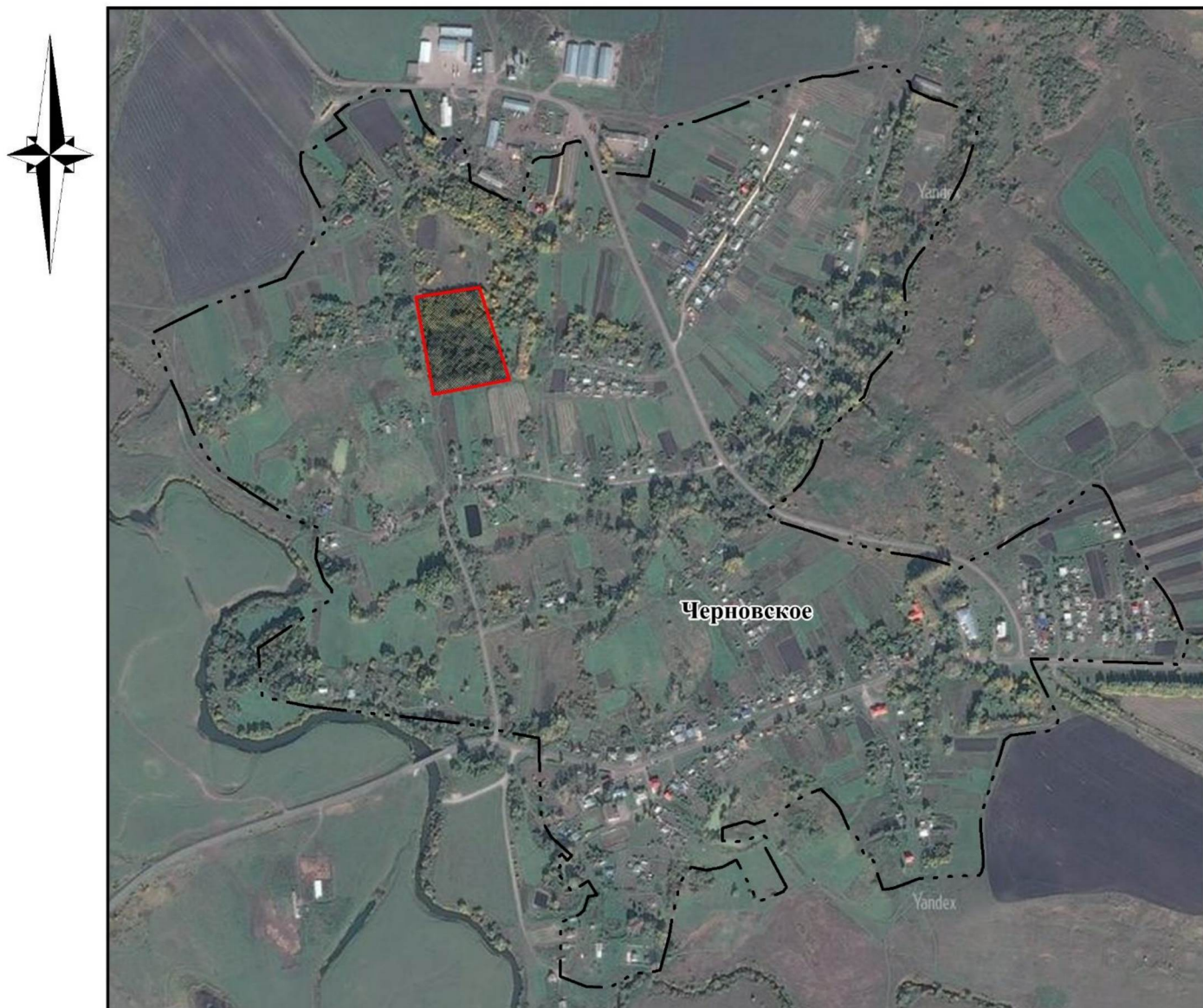
СХЕМА ГРАНИЦ ПАМЯТНИКА ПРИРОДЫ РЕГИОНАЛЬНОГО ЗНАЧЕНИЯ «ПАРК С. ЧЕРНОВСКОЕ»