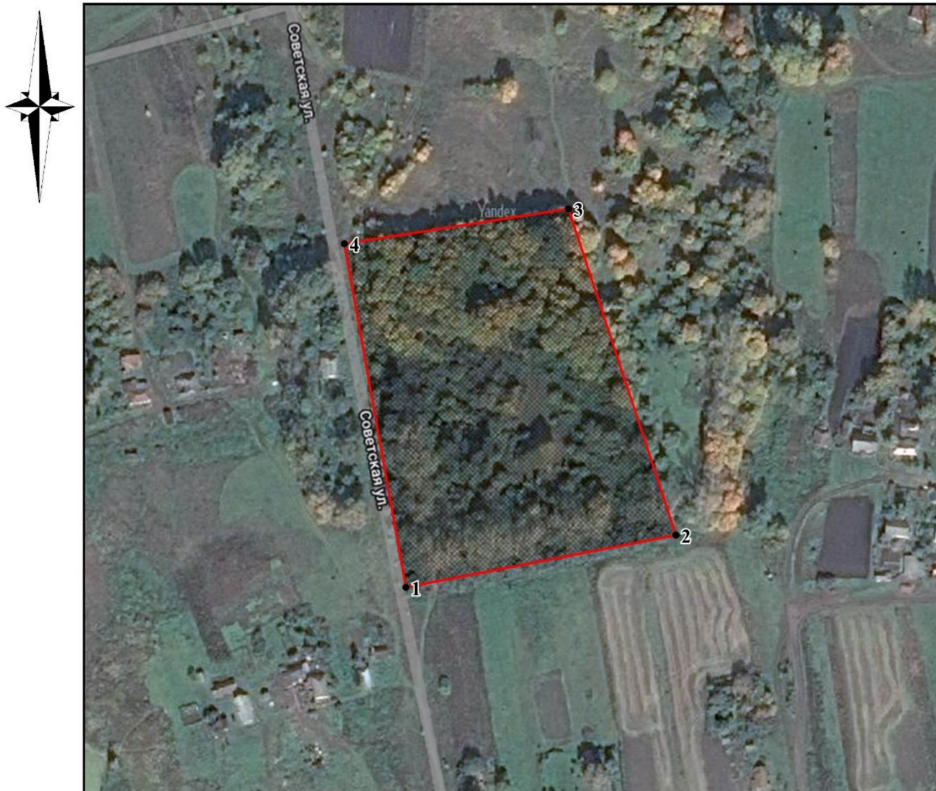
СХЕМА ГРАНИЦ ПАМЯТНИКА ПРИРОДЫ РЕГИОНАЛЬНОГО ЗНАЧЕНИЯ «ПАРК С. ЧЕРНОВСКОЕ»