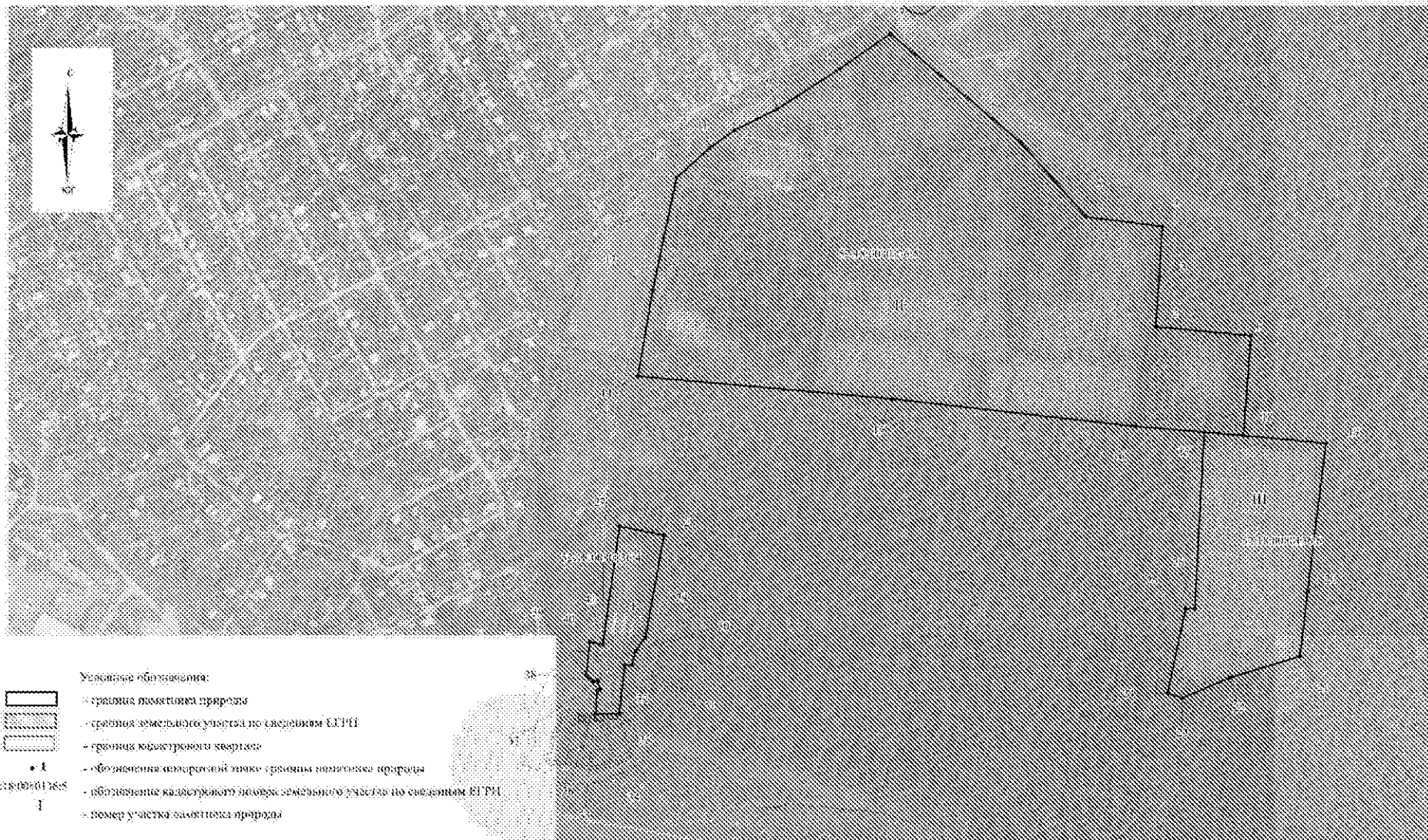
СХЕМА ГРАНИЦ ПАМЯТНИКА ПРИРОДЫ РЕГИОНАЛЬНОГО ЗНАЧЕНИЯ «БОТАНИЧЕСКИЙ САД НИЖЕГОРОДСКОГО УНИВЕРСИТЕТА»