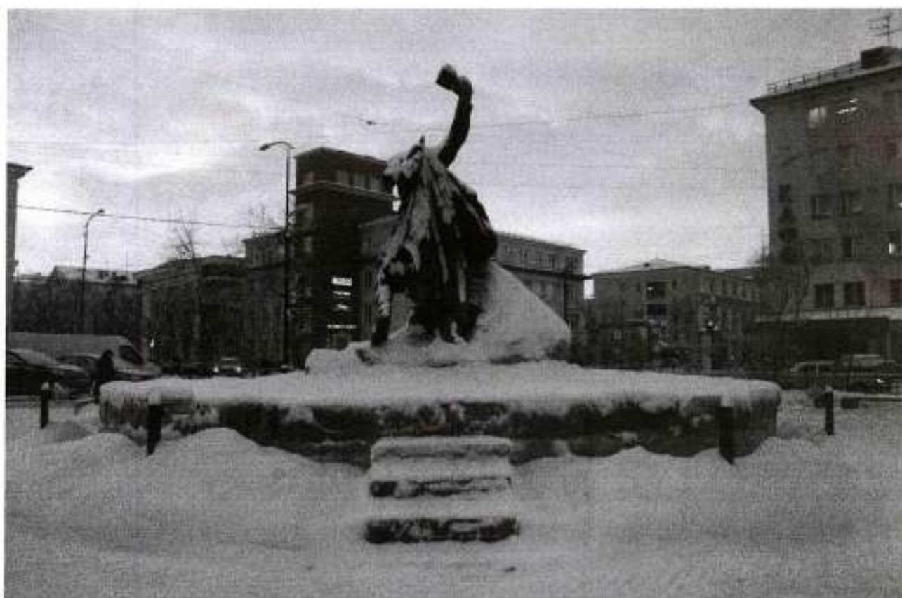
Фото 4. Вид с севера. Объект культурного наследия регионального значения «Памятник Герою Советского Союза Бредову А.» Дата: 20.01.2021