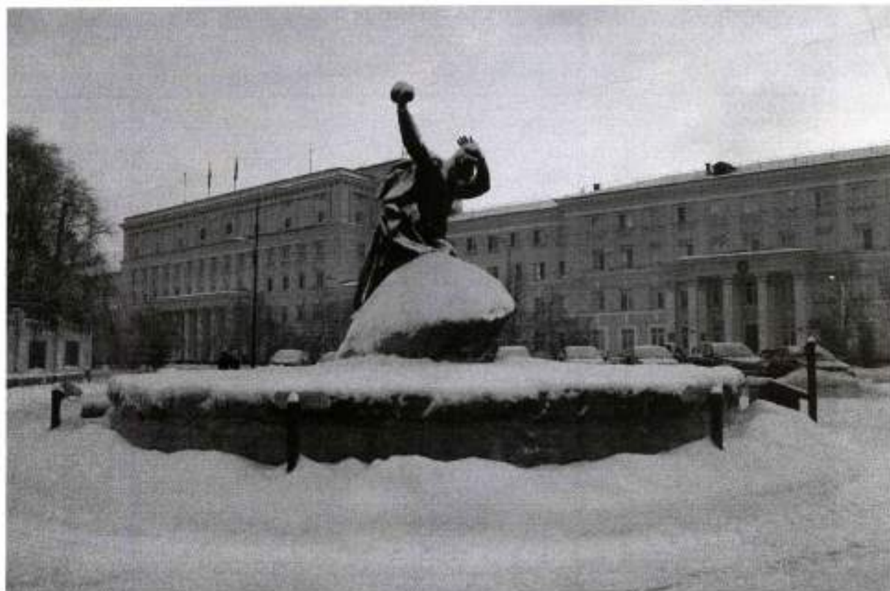
Фото 3. Вид с запада. Объект культурного наследия регионального значения «Памятник Герою Советского Союза Бредову А.». Дата: 20.01.2021