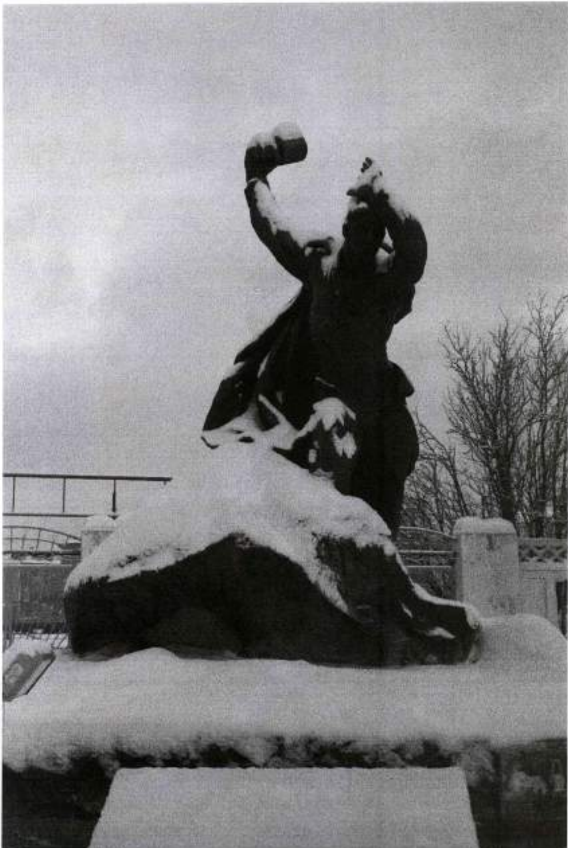
Фото 2. Вид с юга. Объект культурного наследия регионального значения «Памятник Герою Советского Союза Бредову А.». Дата: 20.01.2021