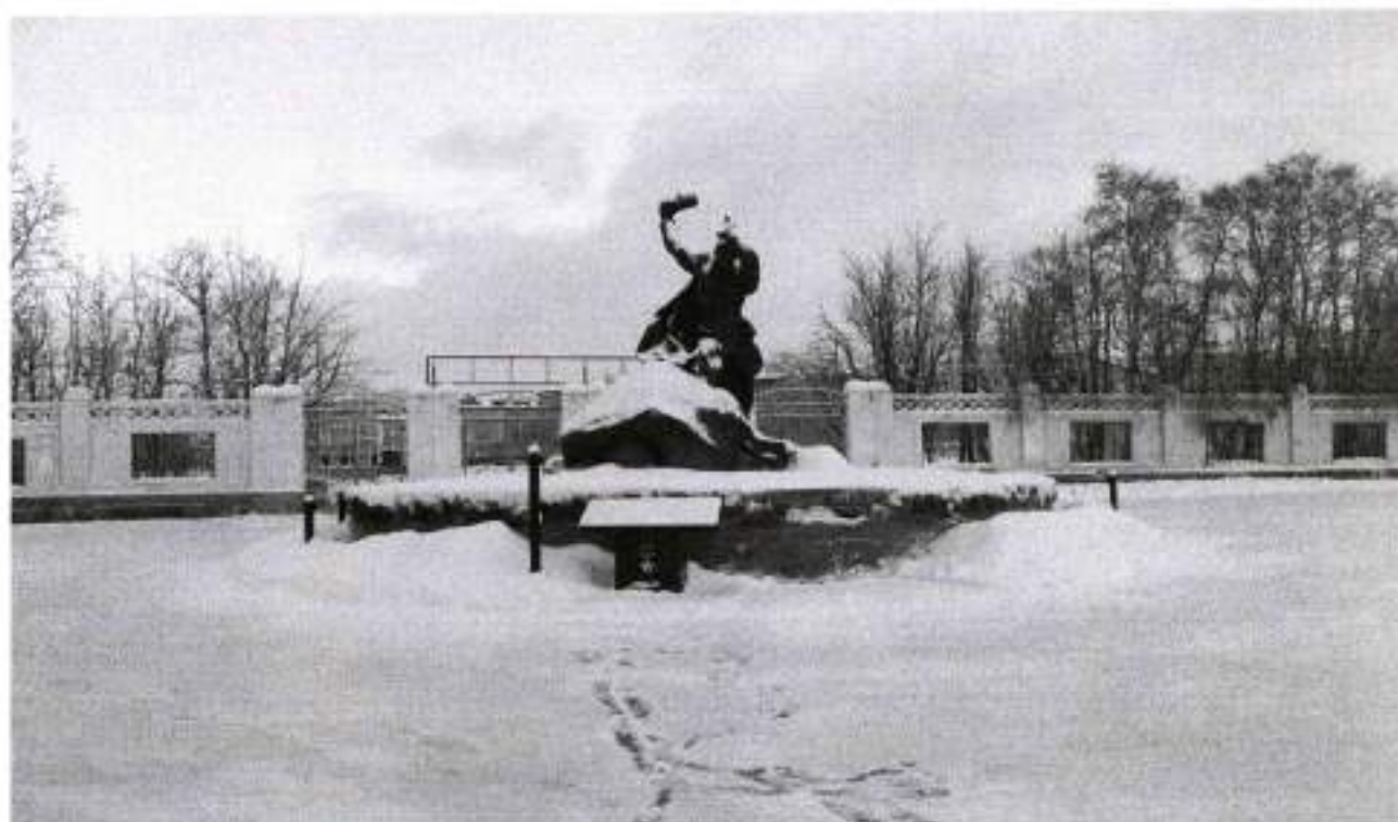
Фото 1. Объект культурного наследия регионального значения «Памятник Герою Советского Союза Бредову А.». Дата: 20.01.2021