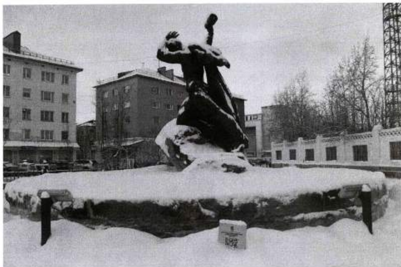
Фото 5. Вид с востока. Объект культурного наследия регионального значения «Памятник Герою Советского Союза Бредову А.». Дата: 20.01.2021