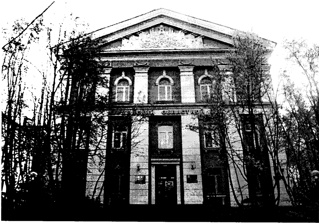
Фото 1. Северо-западный фасад, общий вид