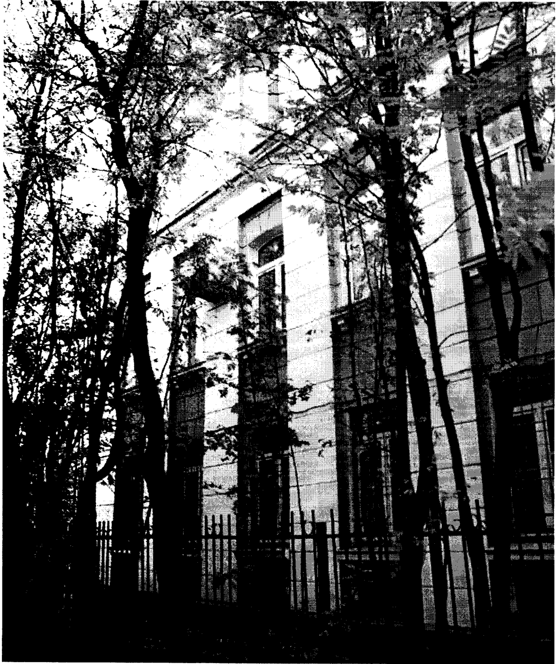
Фото 2. Северо-восточный фасад, северная часть. Общий вид.