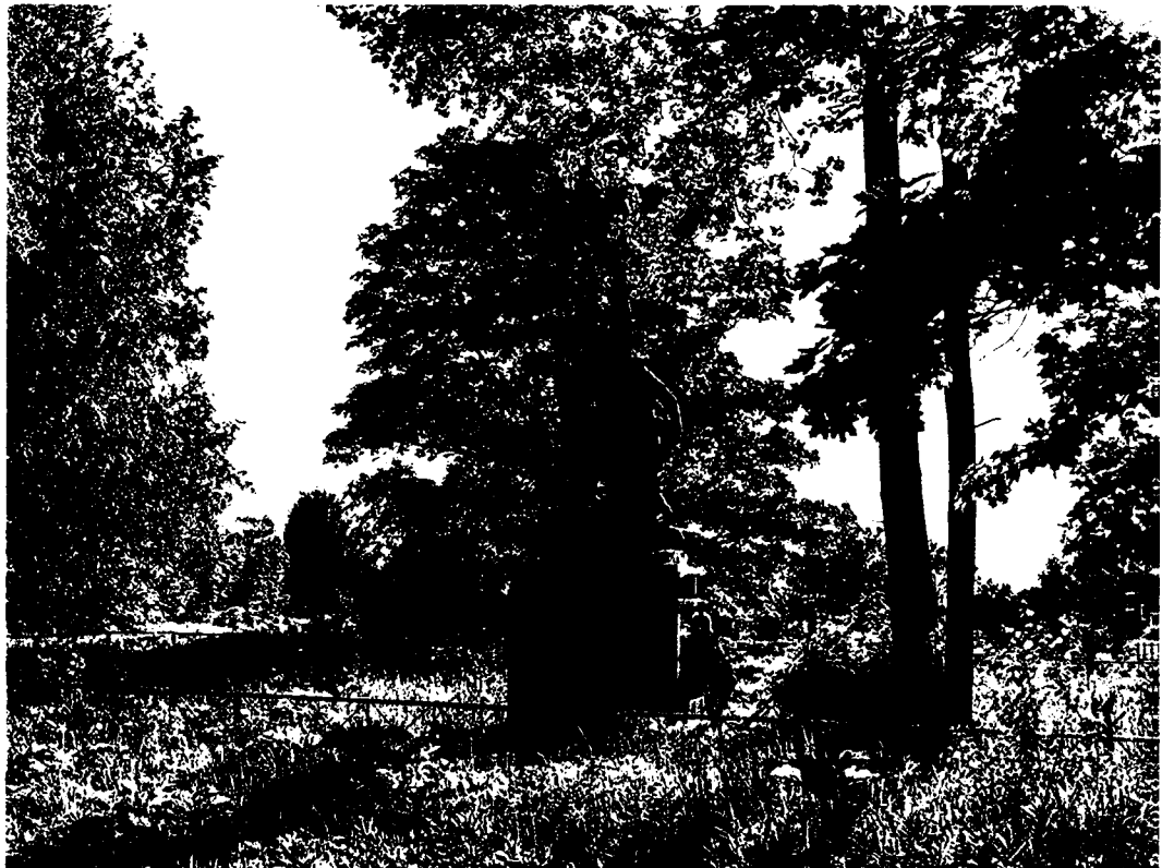
3. Вид с востока