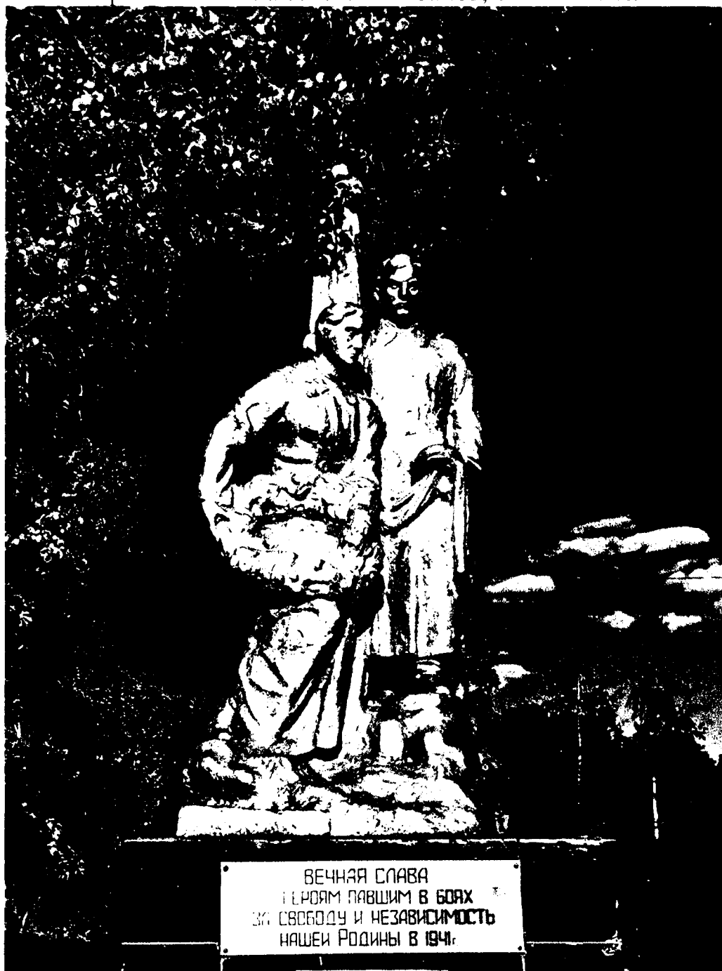
1. Скульптурная композиция

Фотофиксация объекта культурного наследия регионального значения «Братская могила советских воинов, 1941-1942 гг.»