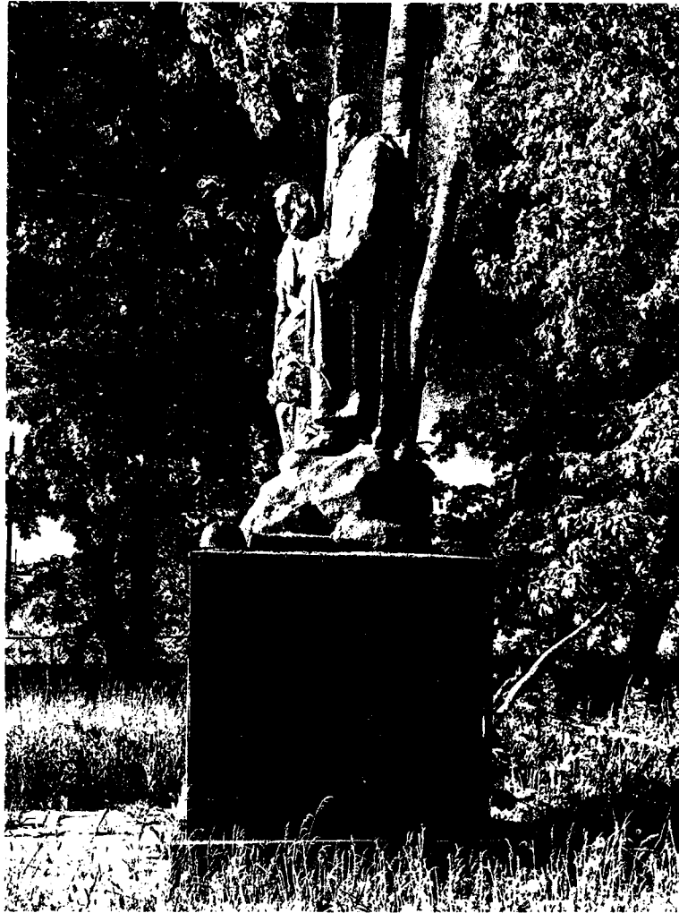
2. Вид с юга