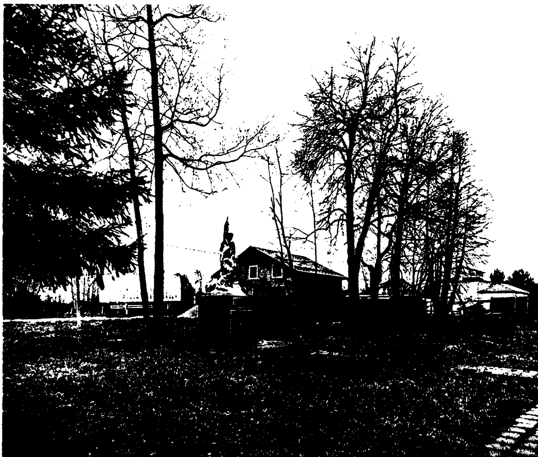
4. Вид с северо-запада