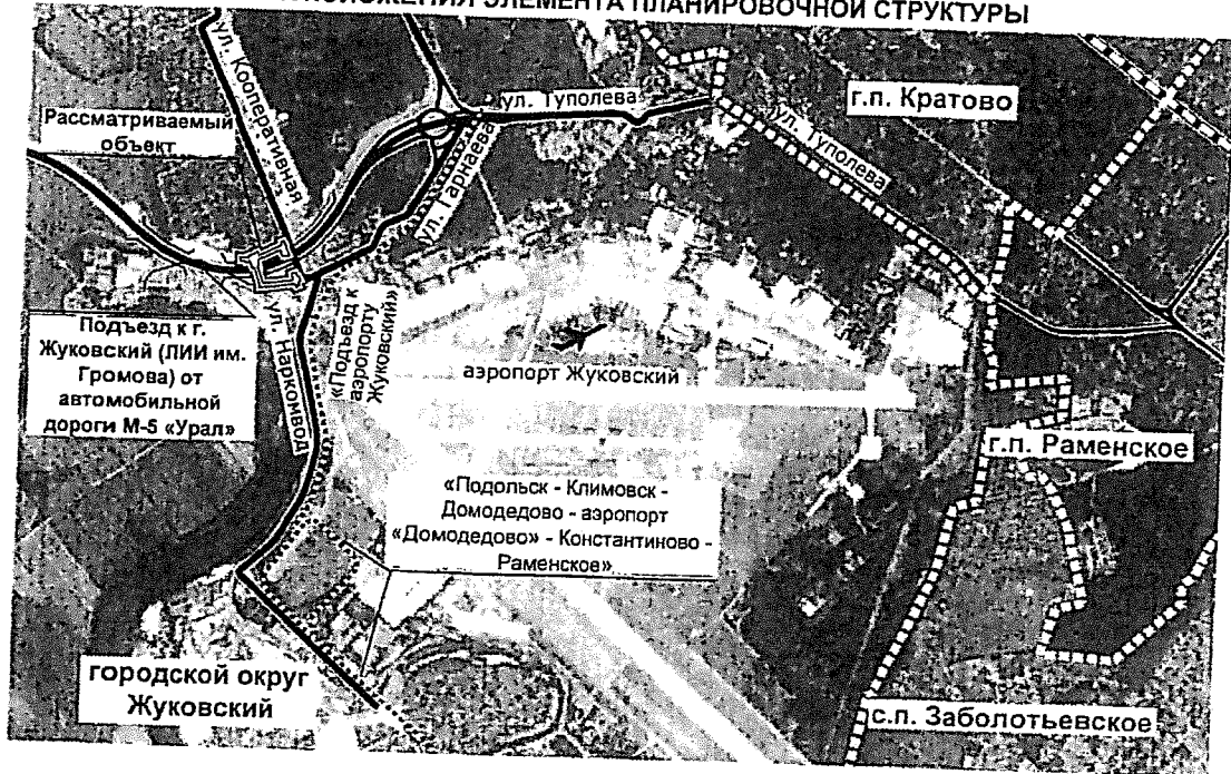
СХЕМА РАСПОЛОЖЕНИЯ ЭЛЕМЕНТА ПЛАНИРОВОЧНОЙ СТРУКТУРЫ