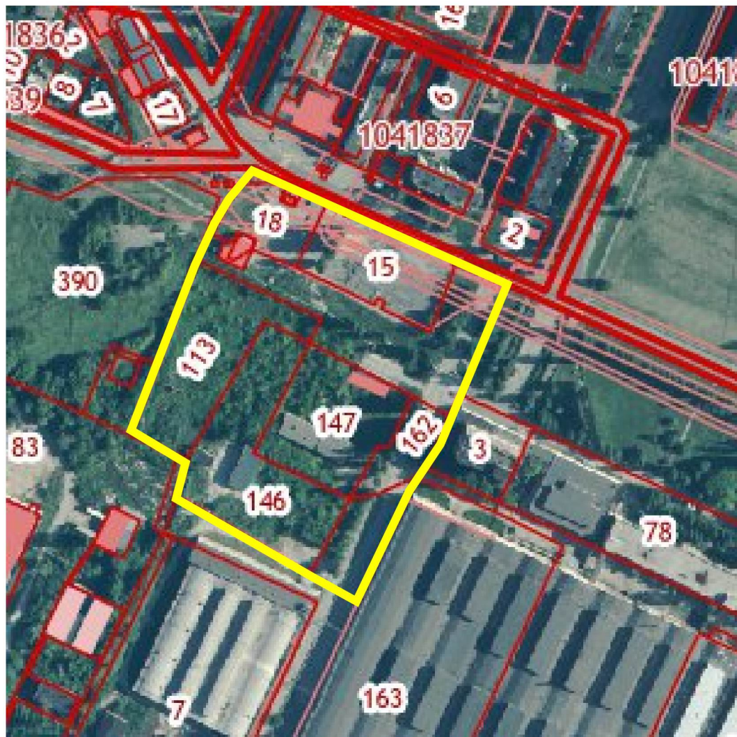
Схема границ территории для подготовки проекта межевания территории в районе улицы Гагарина в городе Грязи Грязинского муниципального района