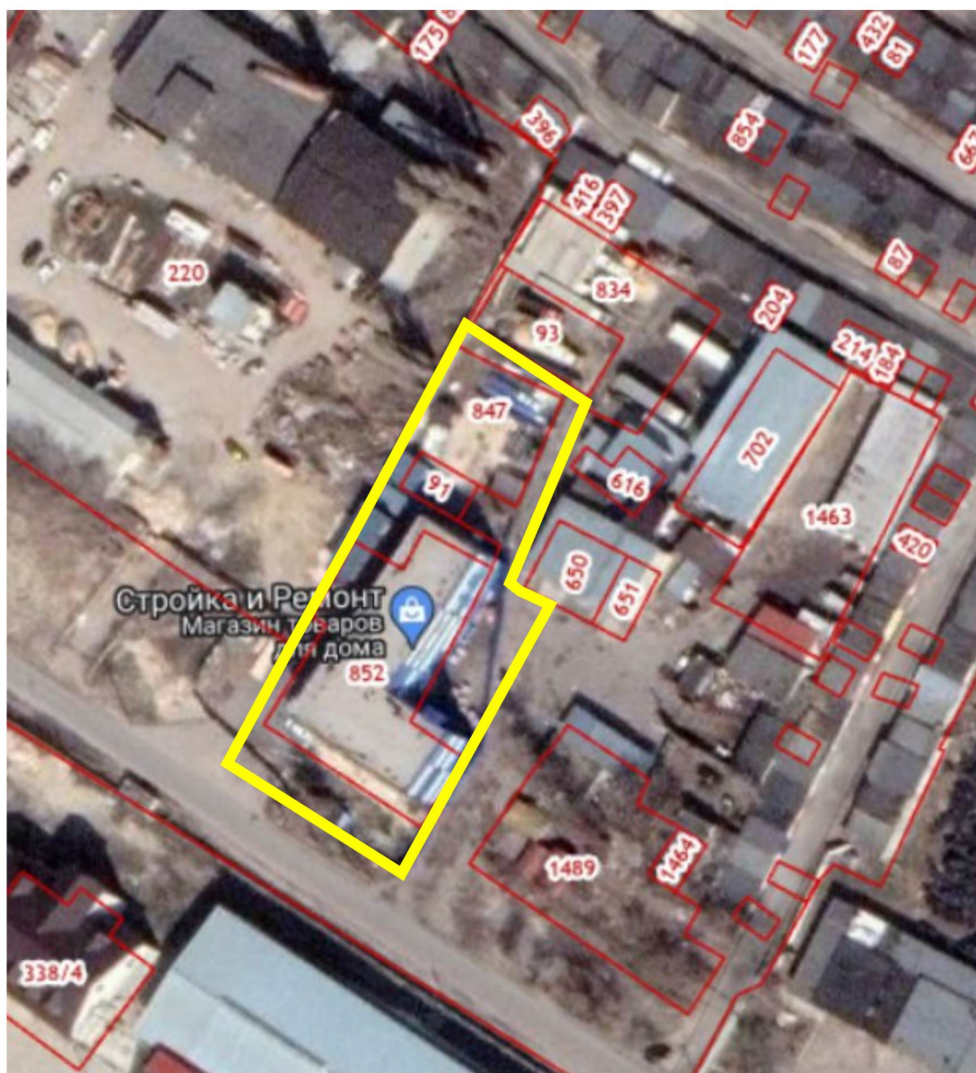
Схема границ территории для подготовки проекта межевания территории в районе улицы Дубовая в с. Казинка сельского поселения Казинский сельсовет Грязинского муниципального района, в части кадастрового квартала 48:02:0940171