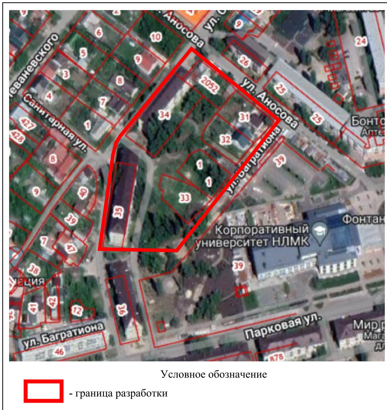
Схема границ территории для подготовки проекта межевания территории, ограниченной улицами Островского, Аносова, Багратиона в городе Липецке