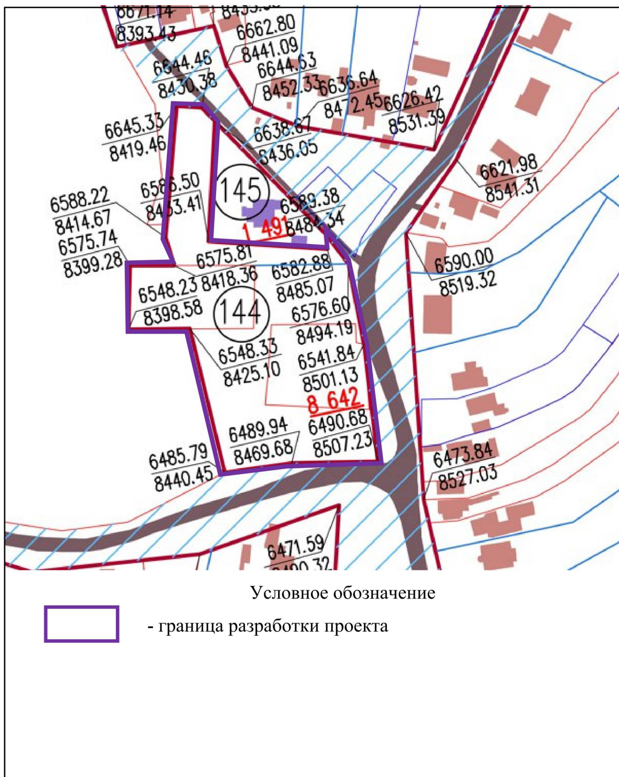
Схема границ территории для подготовки проекта межевания территории в районе улицы Советская в городе Липецке (Сселки, квартал № 144)