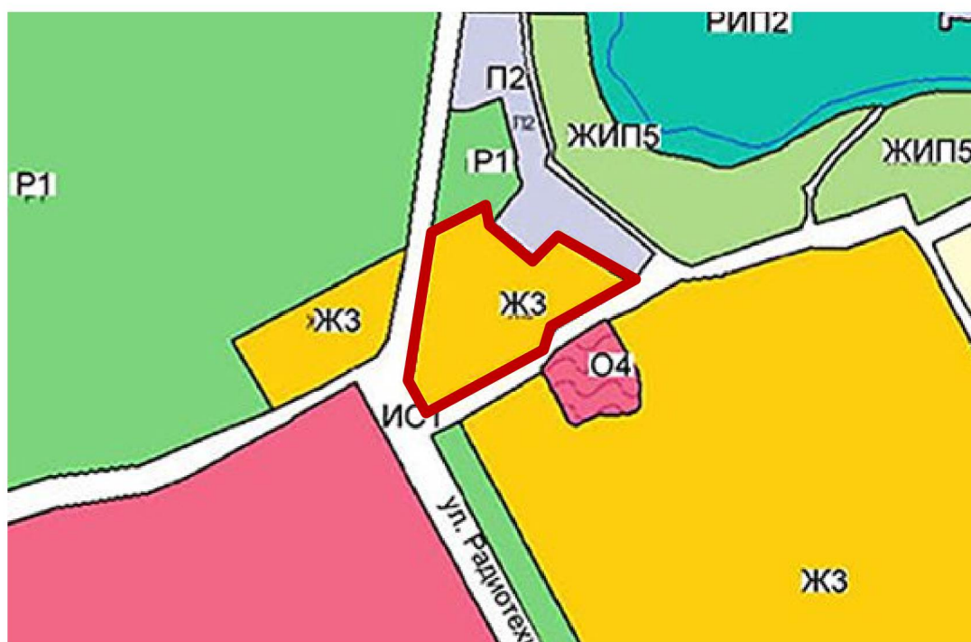
Схема границ территории для подготовки документации по планировке территории (проект планировки и проект межевания) в районе улиц Героев и Воргольская в городском округе город Елец Липецкой области