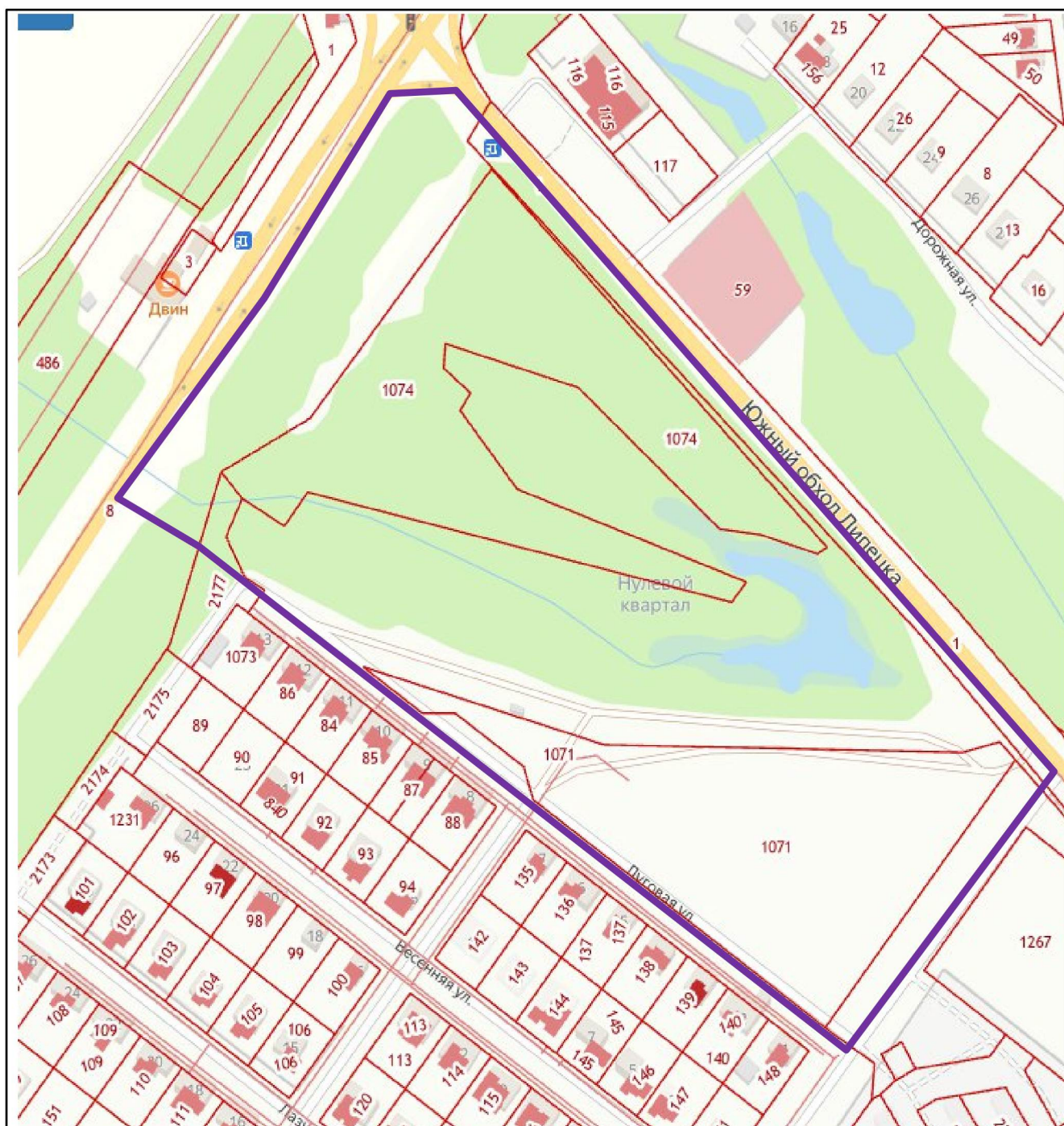
Схема границ территории для подготовки документации по планировке территории (проект планировки и проект межевания) в районе автодороги А-133 и ул. Луговая в селе Ленино Липецкого муниципального округа