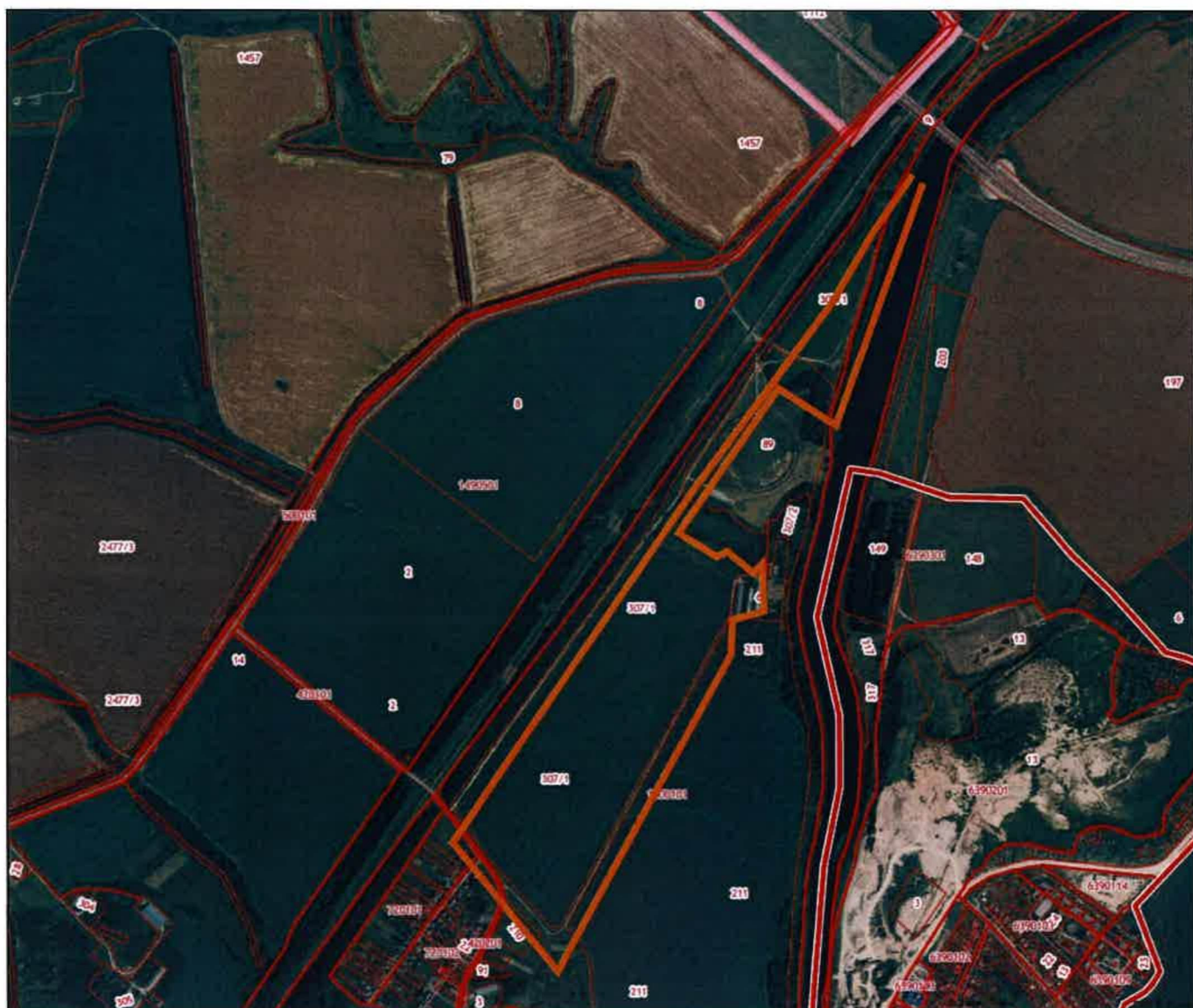
Схема границ территории документации по планировке территории (проект планировки и проект межевания) в районе ул. Молодежной в п. Елецкий Елецкого муниципального района