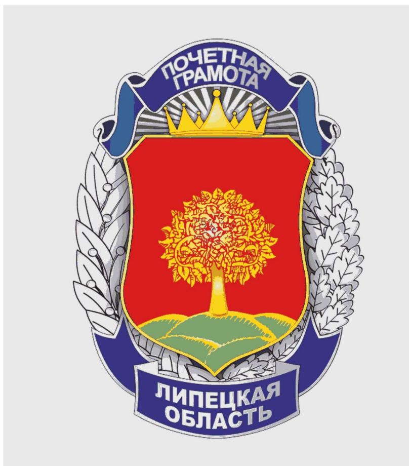
Рисунок и описание нагрудного знака к Почетной грамоте Губернатора Липецкой области

Нагрудный знак к Почетной грамоте Губернатора Липецкой области (далее - знак) размером 18 мм по горизонтали и 24 мм по вертикали представляет собой венок из двух ветвей (лавровой слева и дубовой справа) серебристого металла, соединенных сверху и снизу лентами, покрытыми темно-синей эмалью. Верхняя лента сопровождается надписью в две строки: «ПОЧЕТНАЯ ГРАМОТА» и подпержена сиянием в виде восходящего солнечного диска из серебристого металла с исходящими из него лучами и короной из металла золотого цвета. Надпись на нижней ленте: «ЛИПЕЦКАЯ ОБЛАСТЬ» выполнена также в две строки.