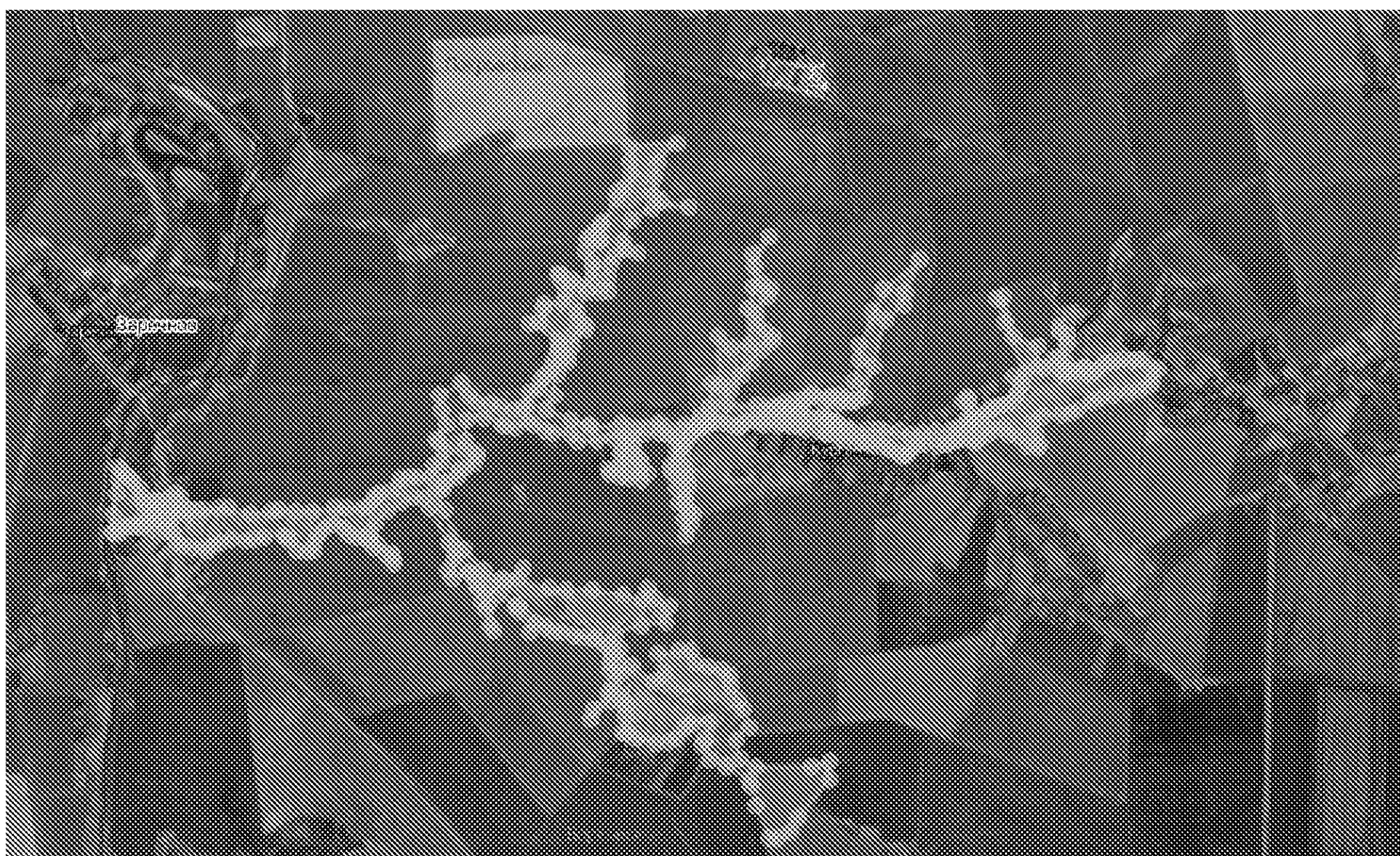
Схема размещения государственного природного ландшафтного заказника регионального значения «Тербунский» (далее – Заказник) в Тербунском муниципальном районе Липецкой области

Границы и особенности режима особой охраны Заказника учитываются при разработке планов и перспектив экономического и социального развития, лесохозяйственных регламентов и проектов освоения лесов, подготовке документов территориального планирования, проведении лесоустройства и инвентаризации земель.