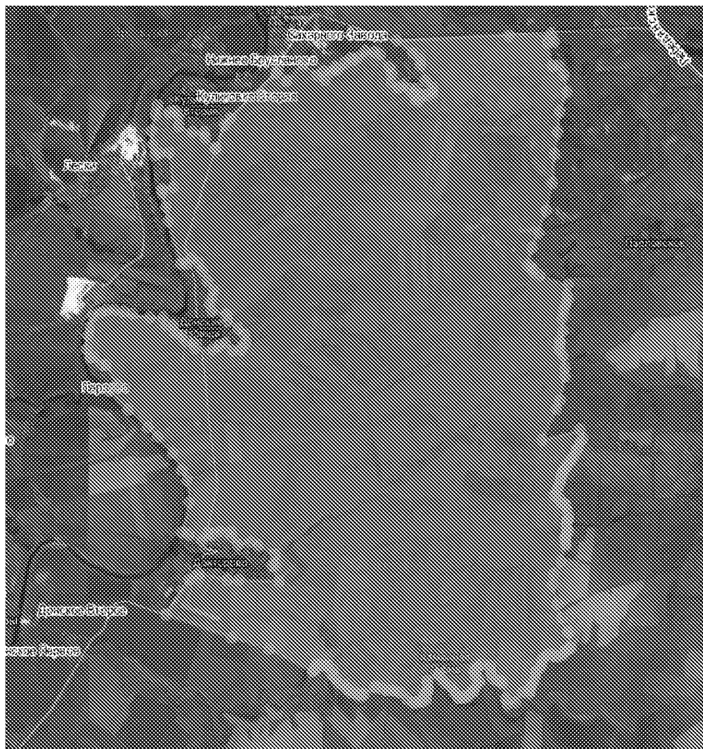
Схема размещения государственного природного ландшафтного заказника регионального значения «Лебедянский» (далее – Заказник) в Лебедянском муниципальном районе Липецкой области

Границы и особенности режима особой охраны Заказника учитываются при разработке планов и перспектив экономического и социального развития, лесохозяйственных регламентов и проектов освоения лесов, подготовке документов территориального планирования, проведении лесоустройства и инвентаризации земель.