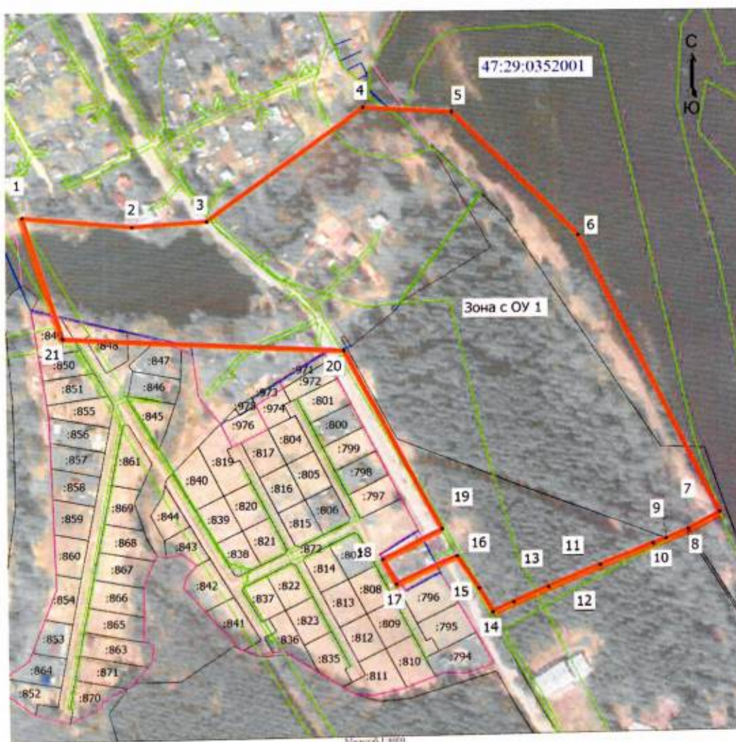
Карта (схема) границ территории объекта культурного наследия

Границы территории объекта культурного наследия регионального значения «Усадьба А.Я. Прозорова «Тосики», расположенного по адресу: Ленинградская область, Лужский муниципальный район, Толмачёвское городское поселение, г.п. Толмачево, участок 2 «О»