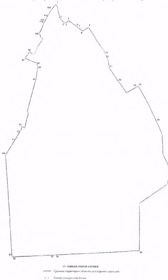
Схема характерных точек границ территории объекта культурного наследия федерального значения «Приоратский парк»