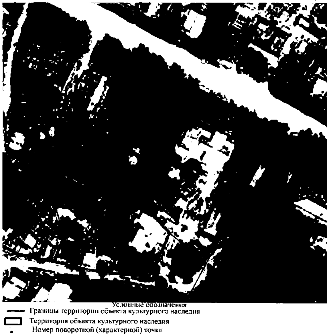
Карта (схема) границ территории объекта культурного наследия

Границы территории объекта культурного наследия регионального значения «Усадебный дом (деревянный)» по адресу: Ленинградская область, Бокситогорский муниципальный район, Ефимовское городское поселение, с. Сомино, ул. Ярославская, д. 43