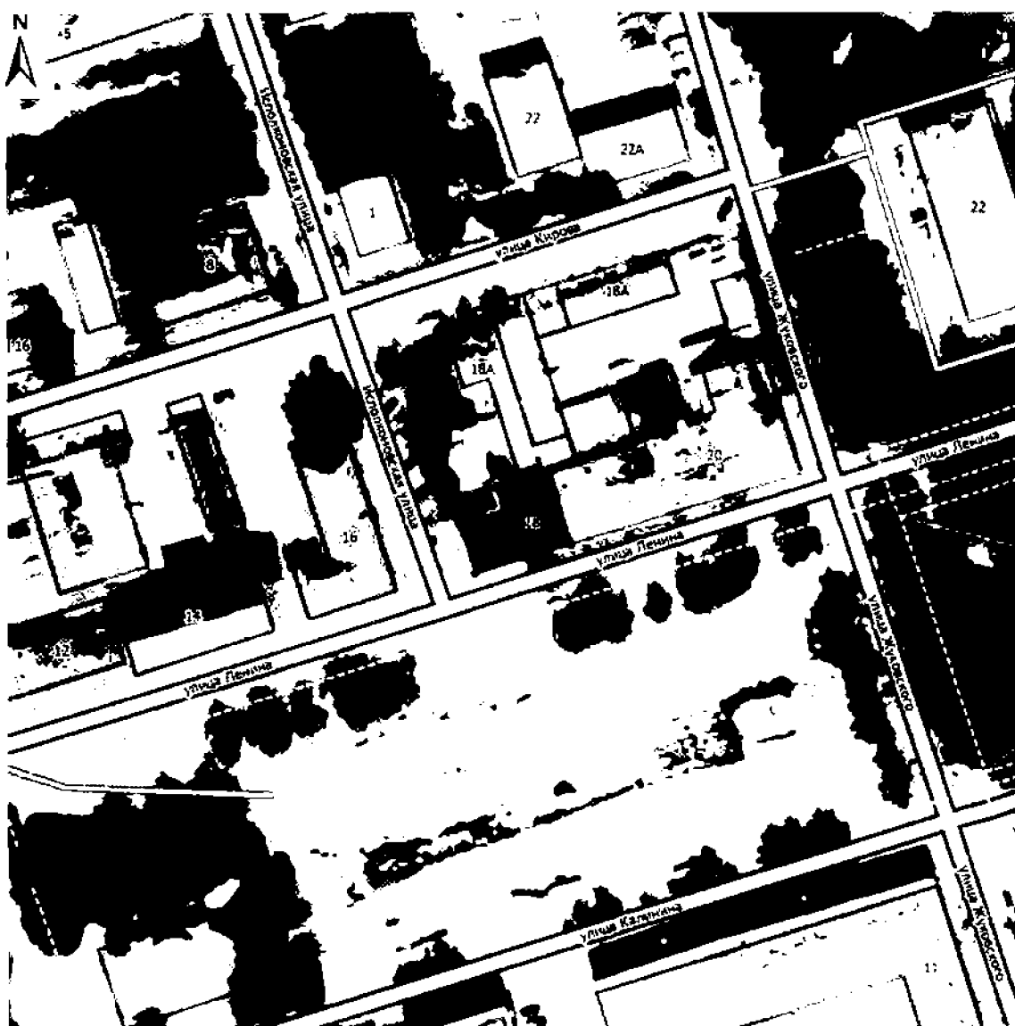
Карта (схема) границ территории объекта культурного наследия