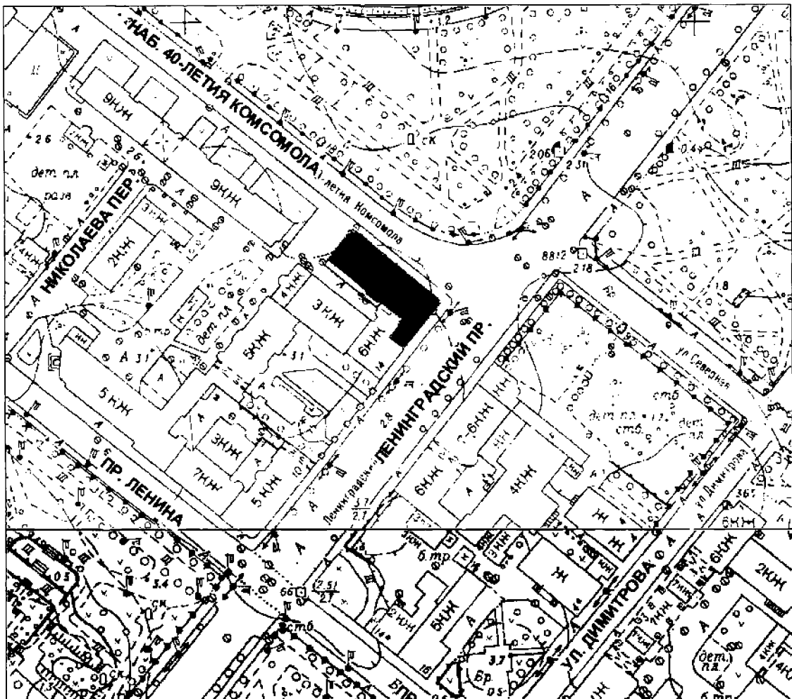
Карта (схема) границ территории объекта культурного наследия

Границы территории объекта культурного наследия регионального значения «Здание бывшей гостиницы «Бельведер», в которой Ленин Владимир Ильич и Крупская Надежда Константиновна жили и работали в августе 1906 г. во время подготовки к изданию газеты «Пролетарий» по адресу: Ленинградская область, Выборгский муниципальный район, г. Выборг, пр-кт. Ленинградский, д. 16