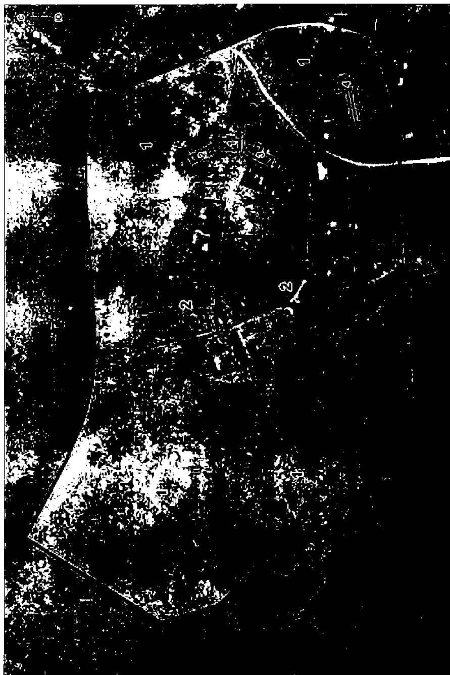
Схема зонирования территории объекта культурного наследия «Усадьба Вороницкая, бывшее владение К.Р. Литгарта, семьи Енгальчевых», достопримечательное место, в составе: 1. Усадебное здание, 2. Северный флигель, 3. Южный флигель, 4. Оранжерея, 5. Парк, расположенного по адресу: Ленинградская область, Ломоносовский район, д. Воронино.

Экспликация объектов культурного наследия: