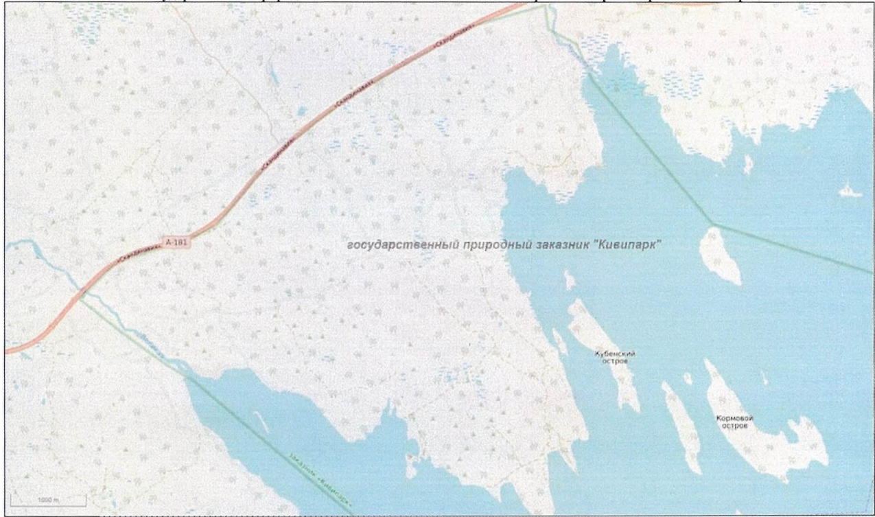
Масштаб 1 : 30 000

*схема подготовлена с использованием РГИС ЛО