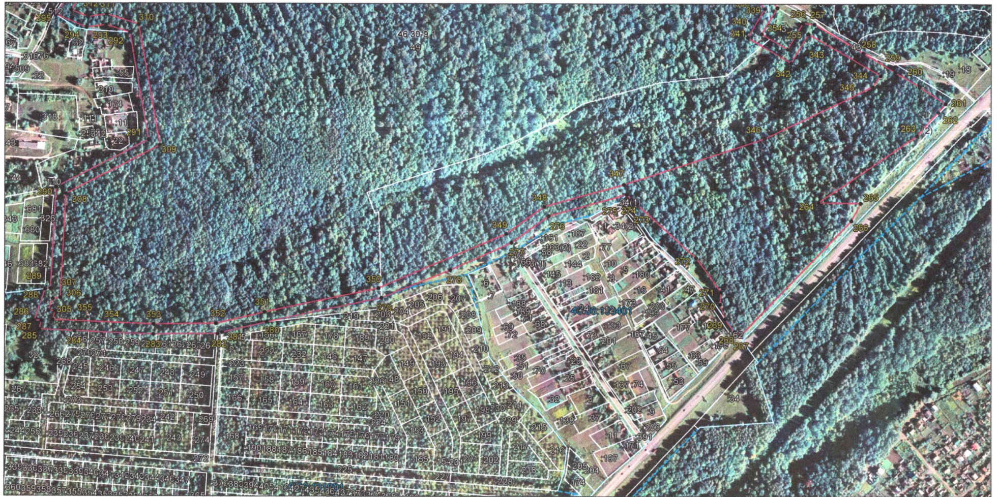
Выносной лист 5