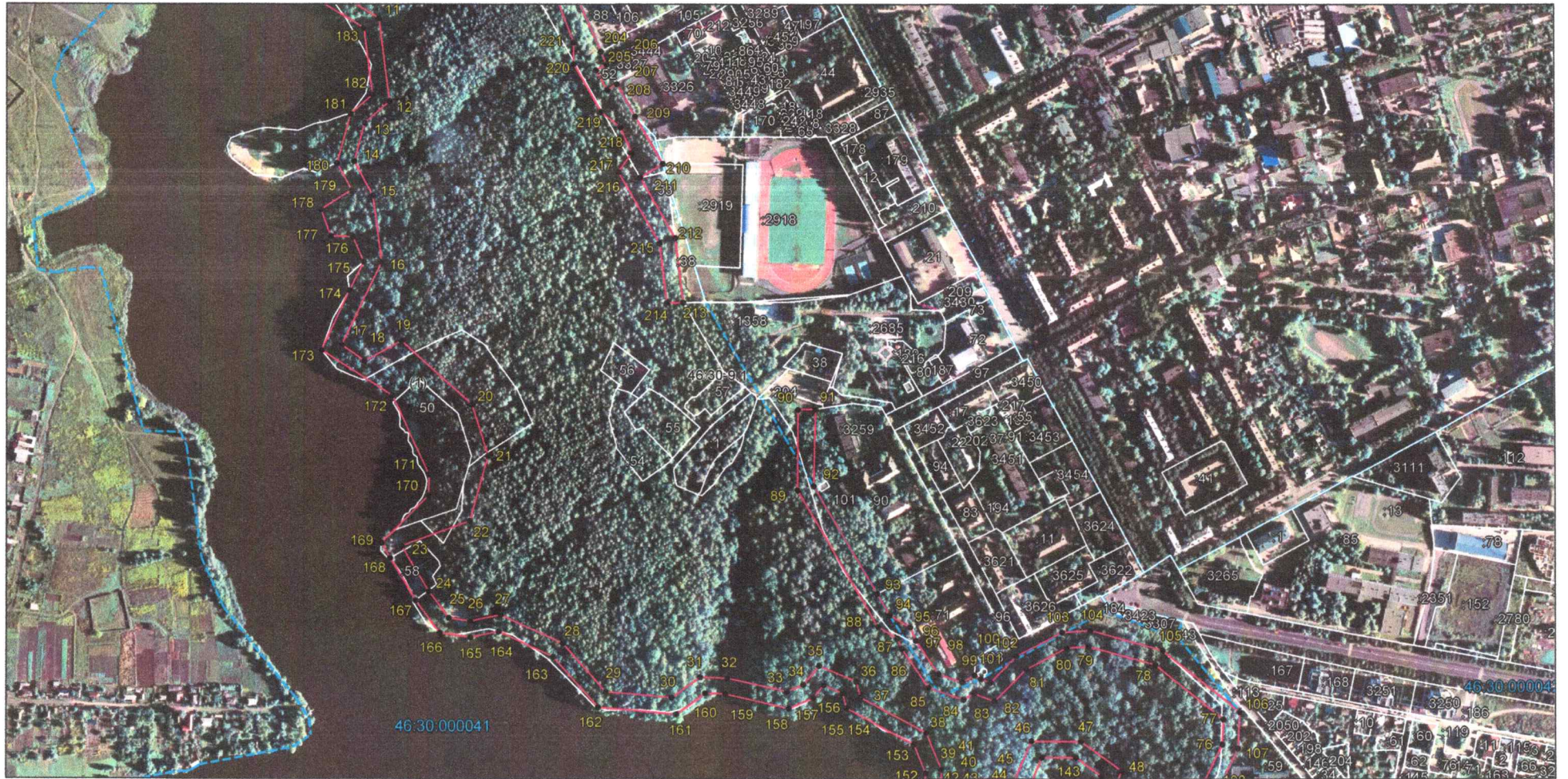
Выносной лист 2