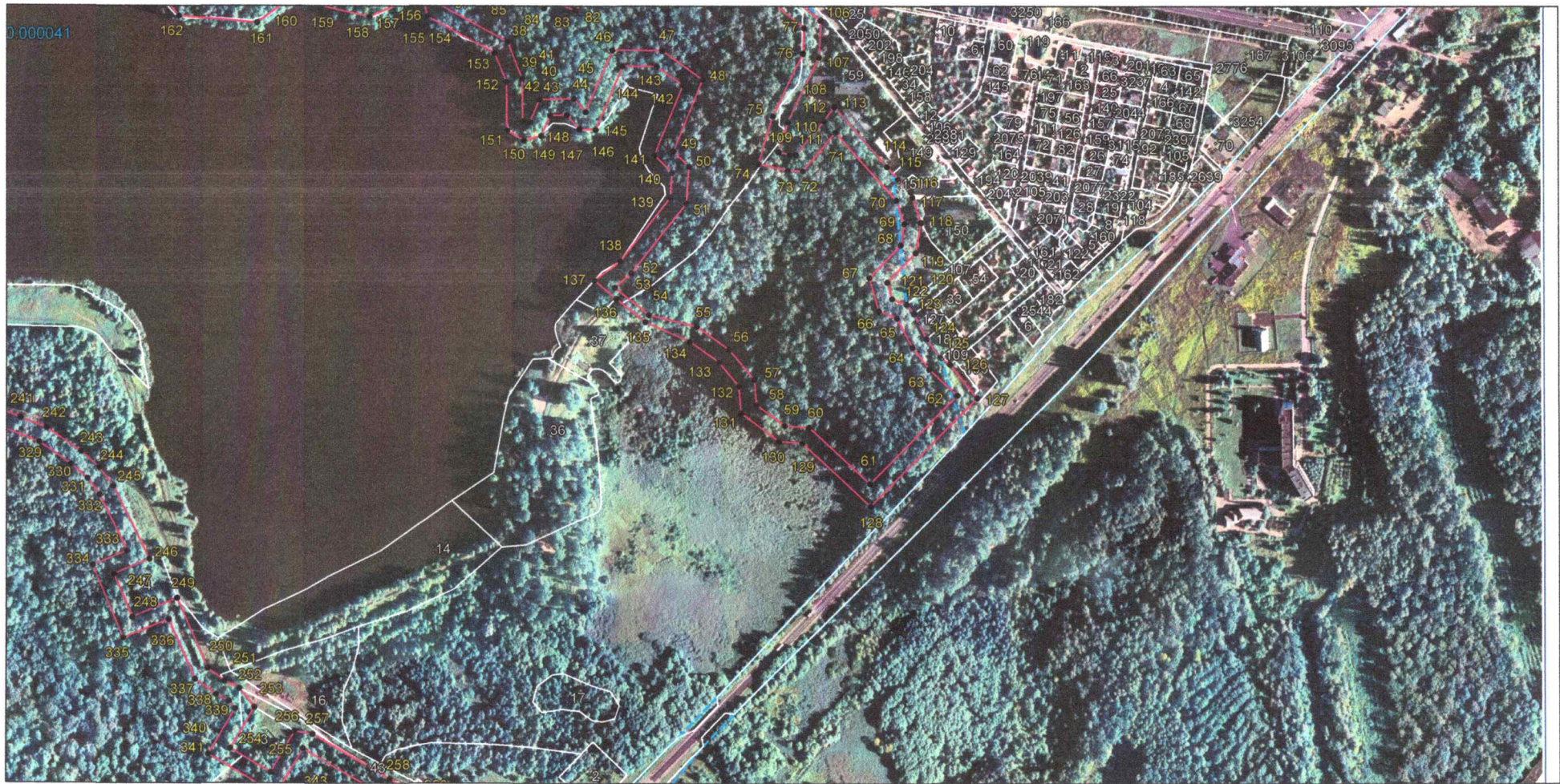
Выносной лист 3