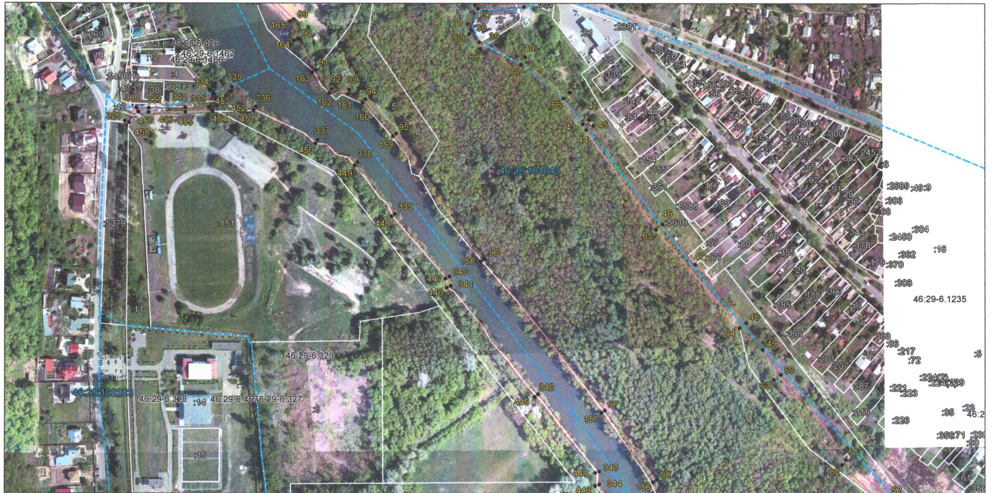
Выносной лист 3