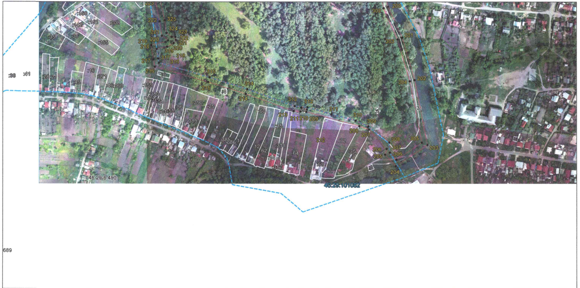
Выносной лист 8