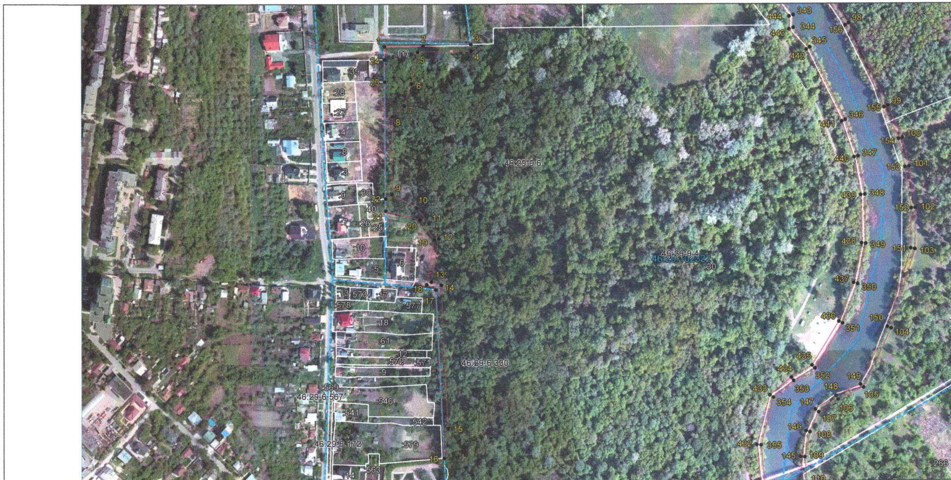
Выносной лист 1