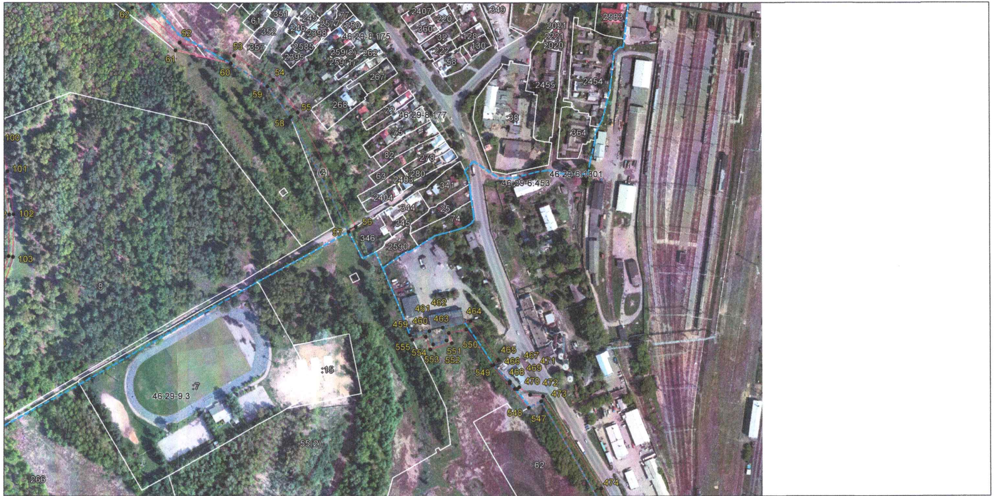
Выносной лист 4