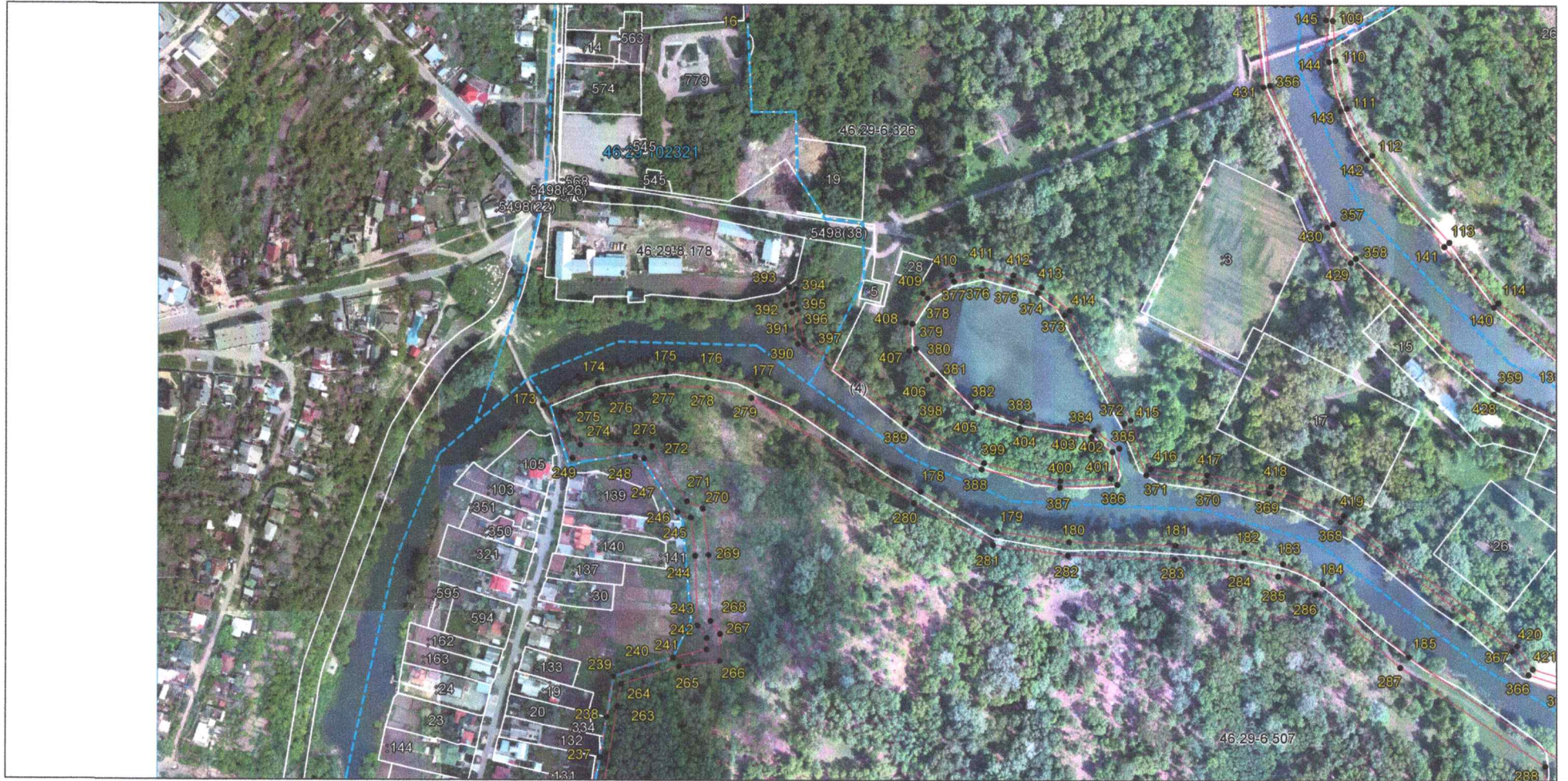
Выносной лист 5