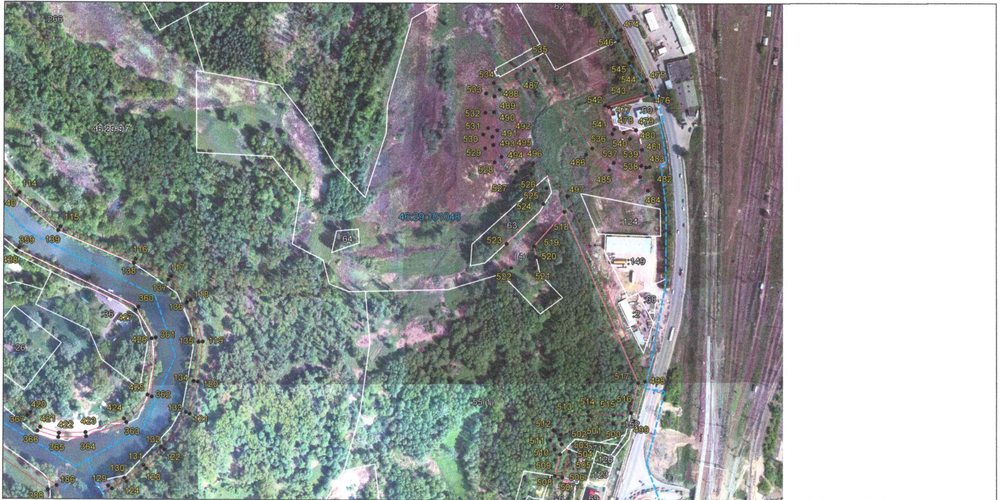
Выносной лист 6