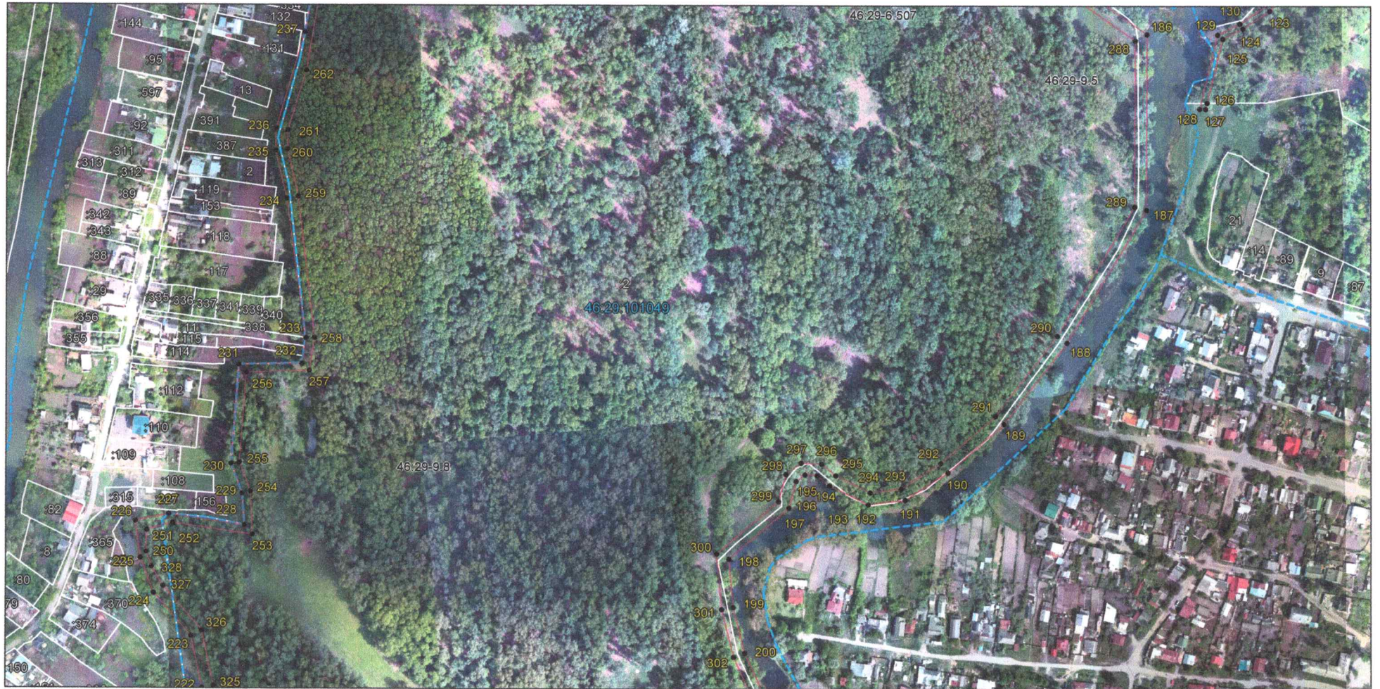
Выносной лист 7