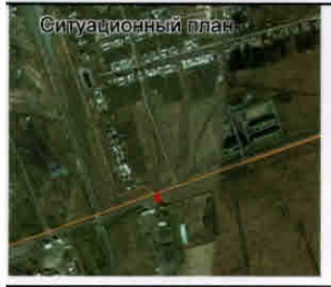
Каталог координат 45:15:000000:918/чзу1 СК Половинное (Половинский)