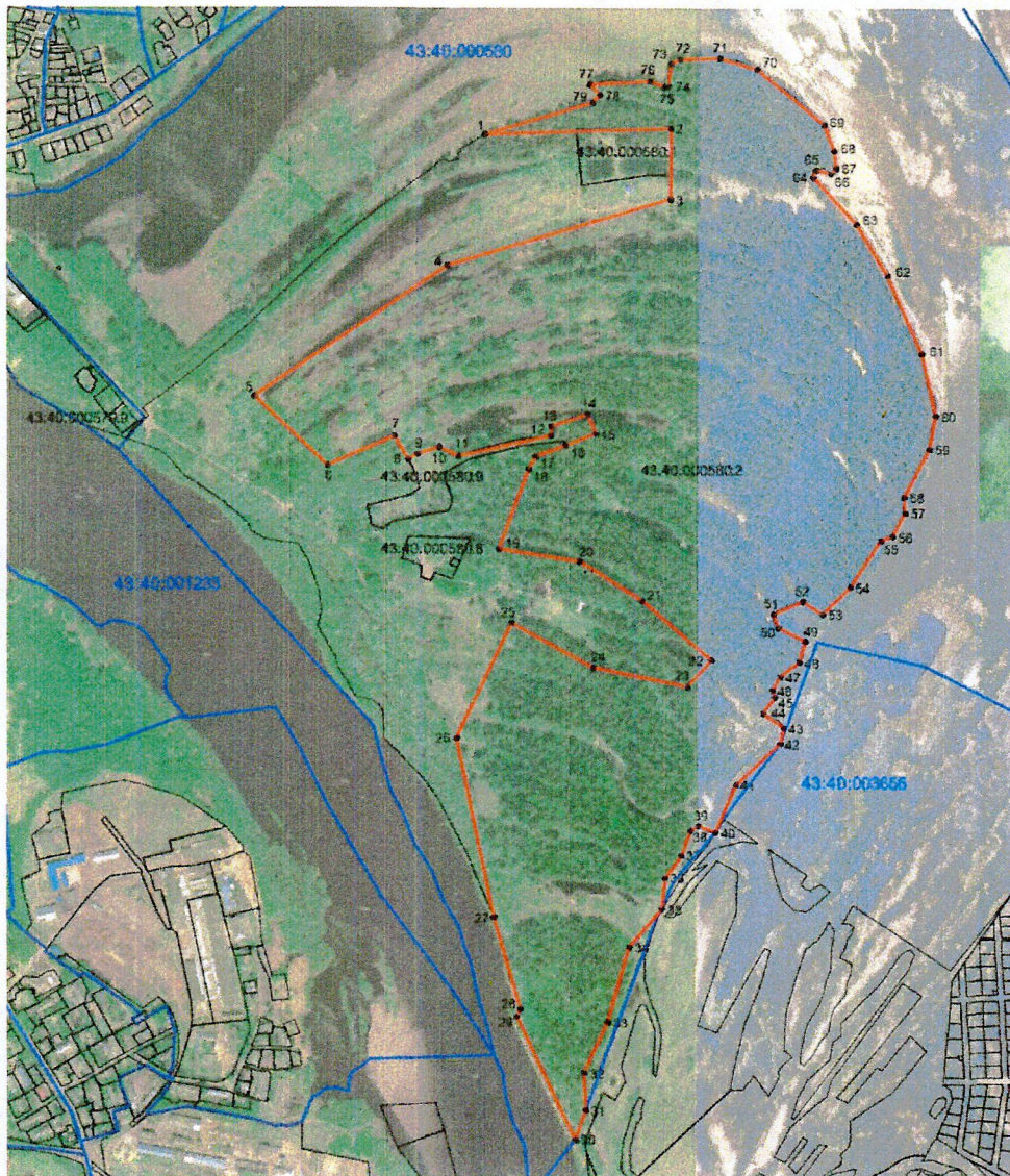
СХЕМА границ зоны строгой охраны памятника природы регионального значения «Заречный парк»

к границам зоны строгой охраны памятника природы регионального значения «Заречный парк»