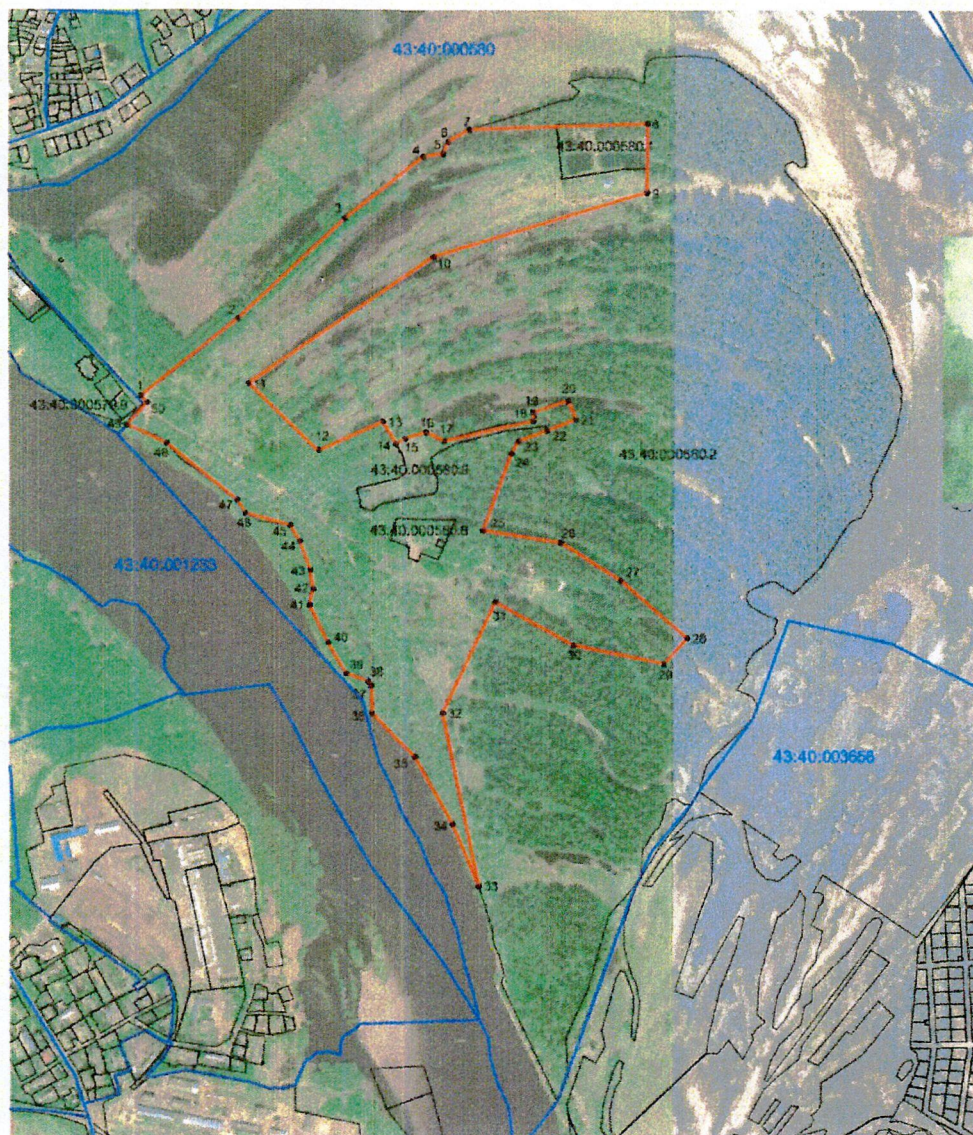
СХЕМА границ рекреационной зоны памятника природы регионального значения «Заречный парк»

к границам рекреационной зоны памятника природы регионального значения «Заречный парк»