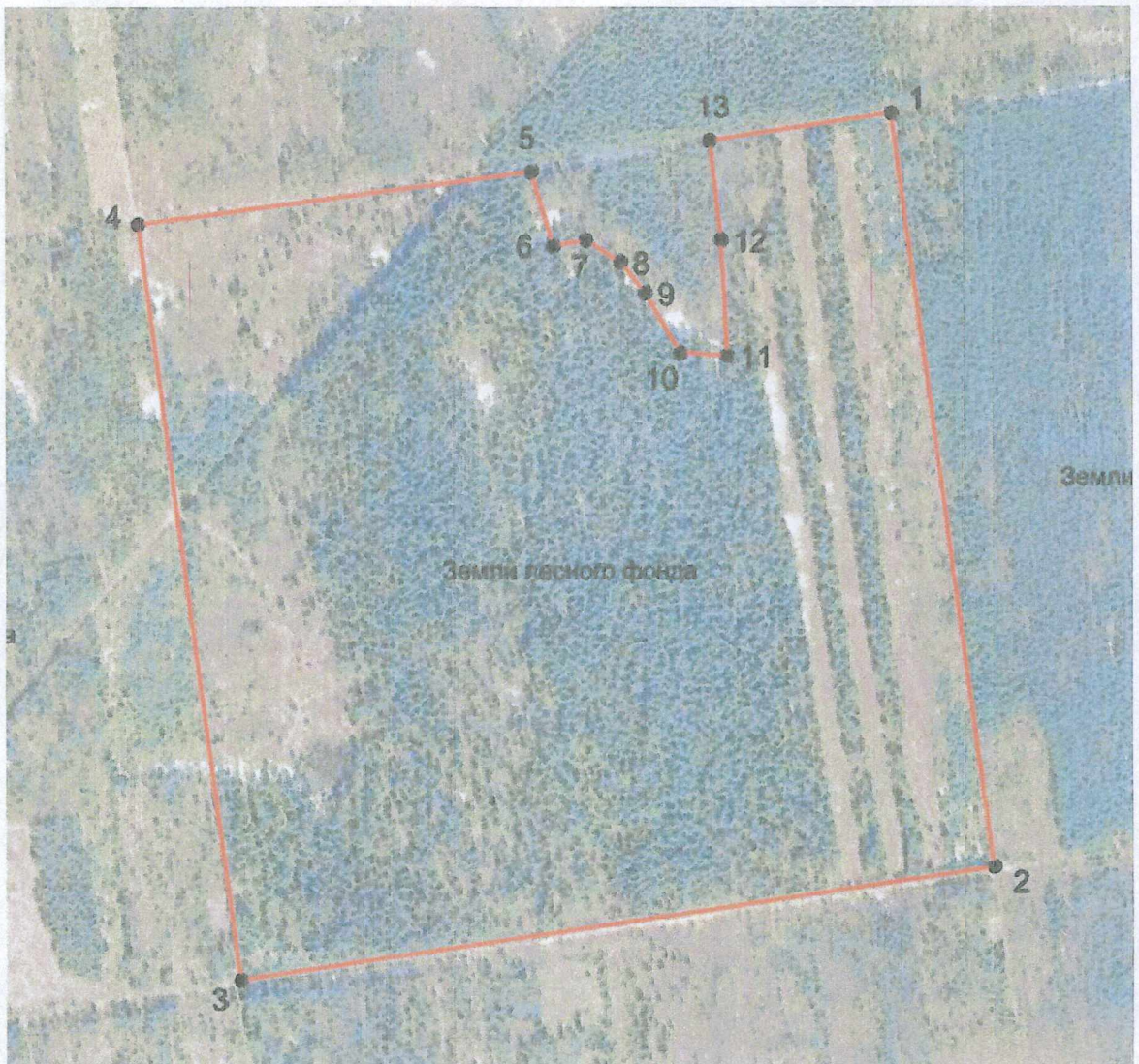
СХЕМА границ территории памятника природы регионального значения «Бурецкий заказник»

к границам территории памятника природы регионального значения «Бурецкий заказник»