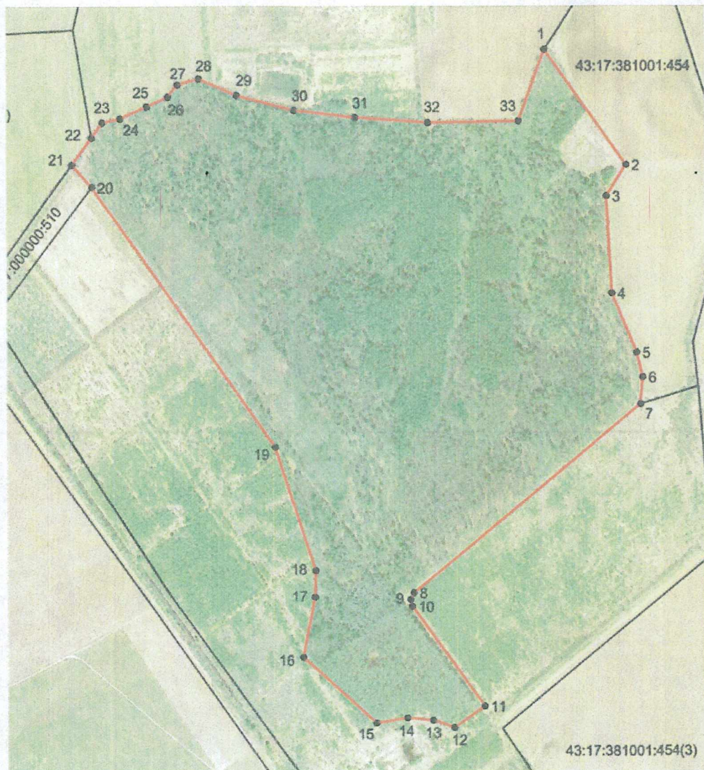
СХЕМА границ территории памятника природы регионального значения «Посадский лес»

к границам территории памятника природы регионального значения «Посадский лес»