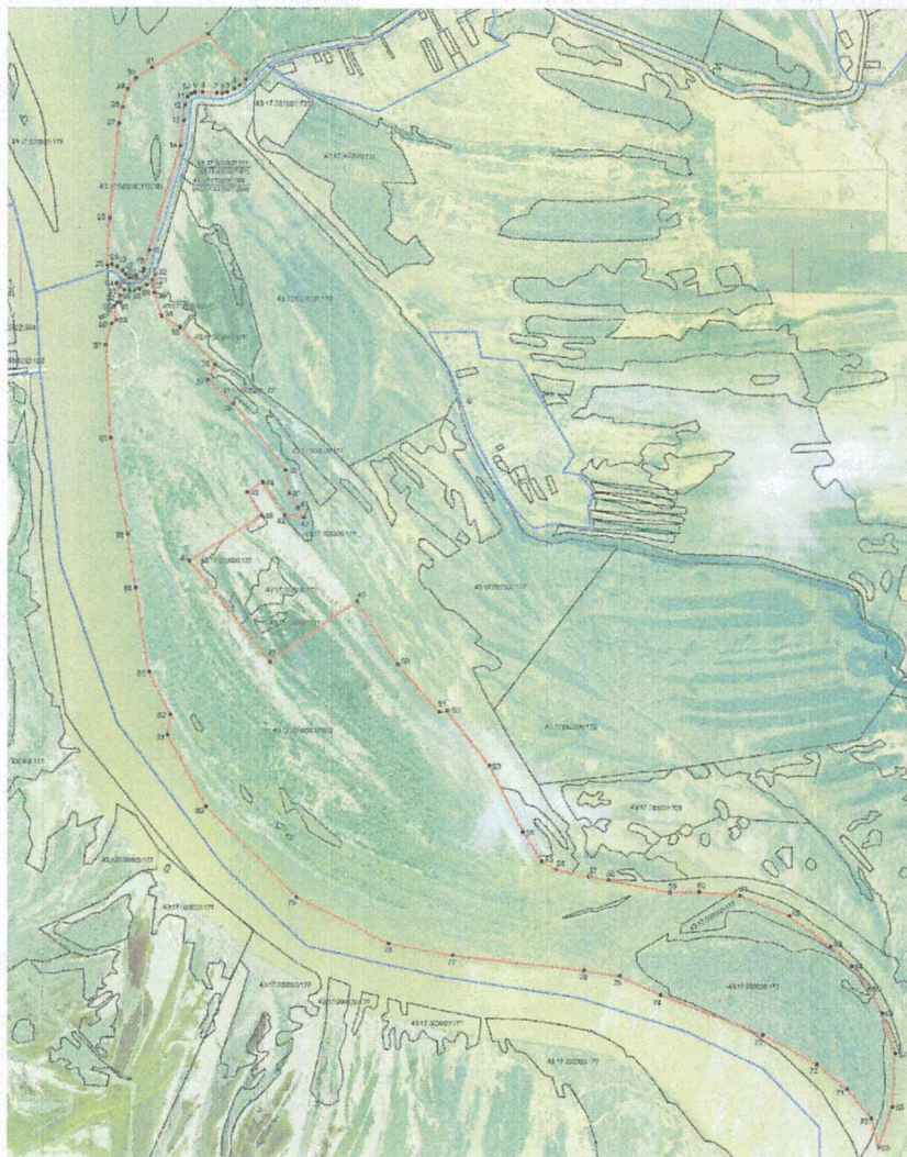
СХЕМА границ территории памятника природы регионального значения «Осокоревая роща у с. Гоньба»

к границам территории памятника природы регионального значения «Осокоревая роща у с. Гоньба»