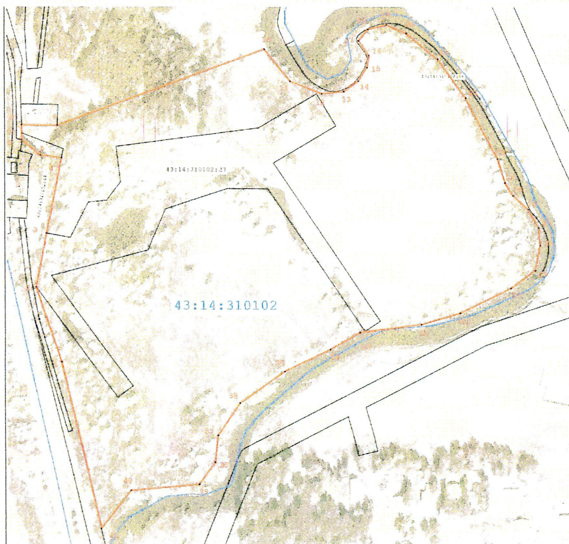
СХЕМА границ территории памятника природы регионального значения «Нижнеивкинские минеральные источники»

к границам территории памятника природы регионального значения «Нижнеивкинские минеральные источники»