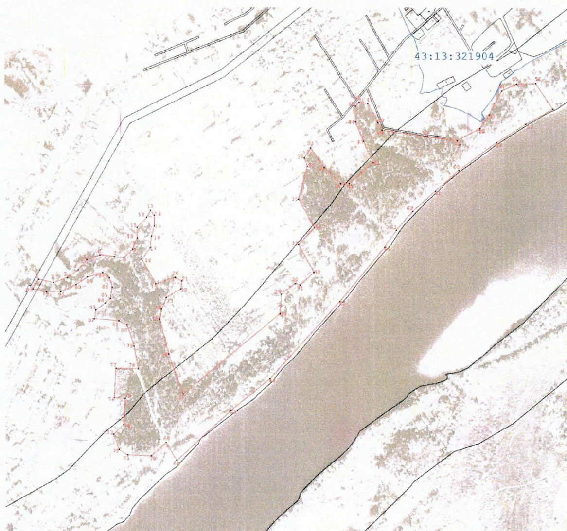
СХЕМА границ территории памятника природы регионального значения «Береговой оползень у д. Климичи»

к границам территории памятника природы регионального значения «Береговой оползень у д. Климичи»