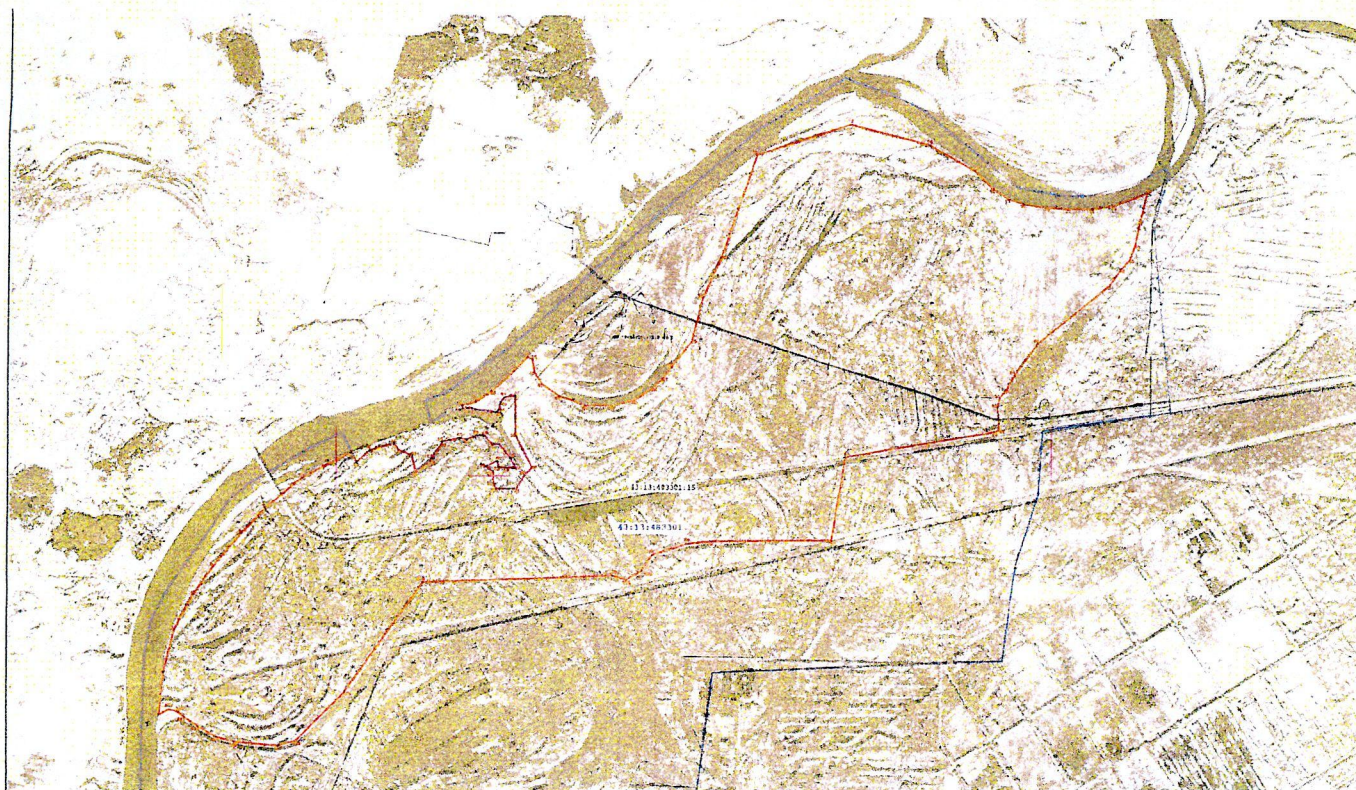
СХЕМА границ территории памятника природы регионального значения «Котельничская пойменная дубовая роща»

к границам территории памятника природы регионального значения «Котельничская пойменная дубовая роща»