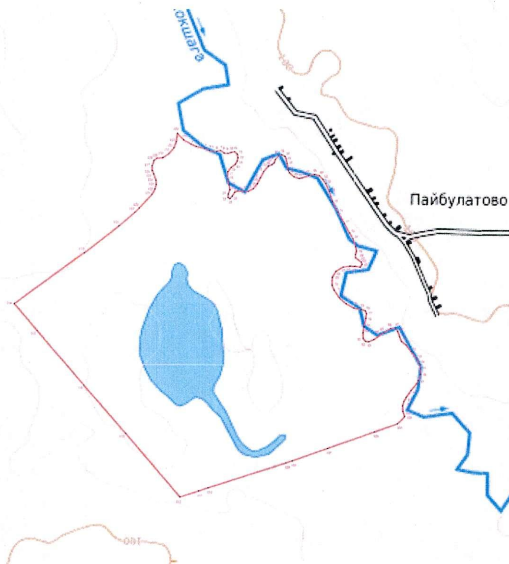
СХЕМА границ охранной зоны памятника природы регионального значения «Озеро Пайбулатовское»

к границам охранной зоны памятника природы регионального значения «Озеро Пайбулатовское»