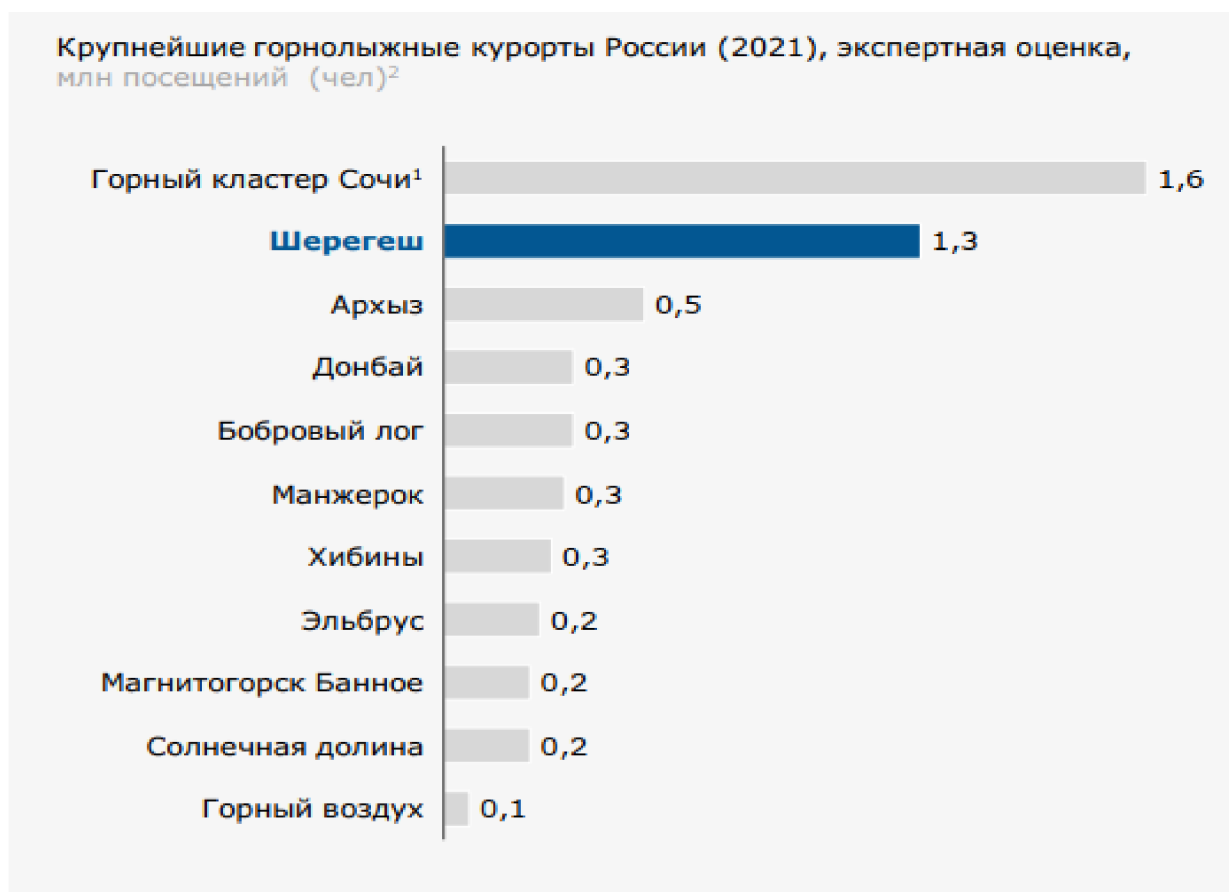
Рисунок 1. Крупнейшие горнолыжные курорты Российской Федерации по данным АО «Стратеджи Партнерс Групп»

Согласно данным АО «Стратеджи Партнерс Групп», на сегодняшний день СТК «Шерегеш» является вторым по посещаемости горнолыжным курортом Российской Федерации (рисунок 1).