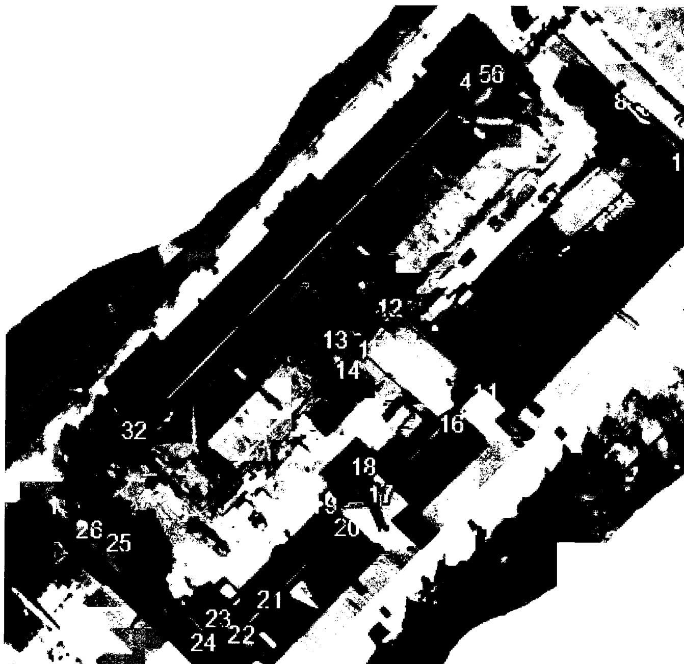
План-схема границ территории объекта культурного наследия федерального значения «Здание управления Сызранско-Вяземской железной дороги, 1895 г.», 1895 г., расположенного по адресу: г. Калуга, ул. Карла Маркса, д. 4