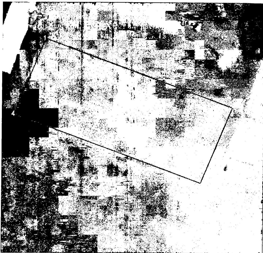
План-схема границ территории объекта культурного наследия (здания) историко-культурного значения «Усадьба», кон. XVII–XIX вв., расположенное по адресу: г. Пуга, ул. Дарвина, д. 15