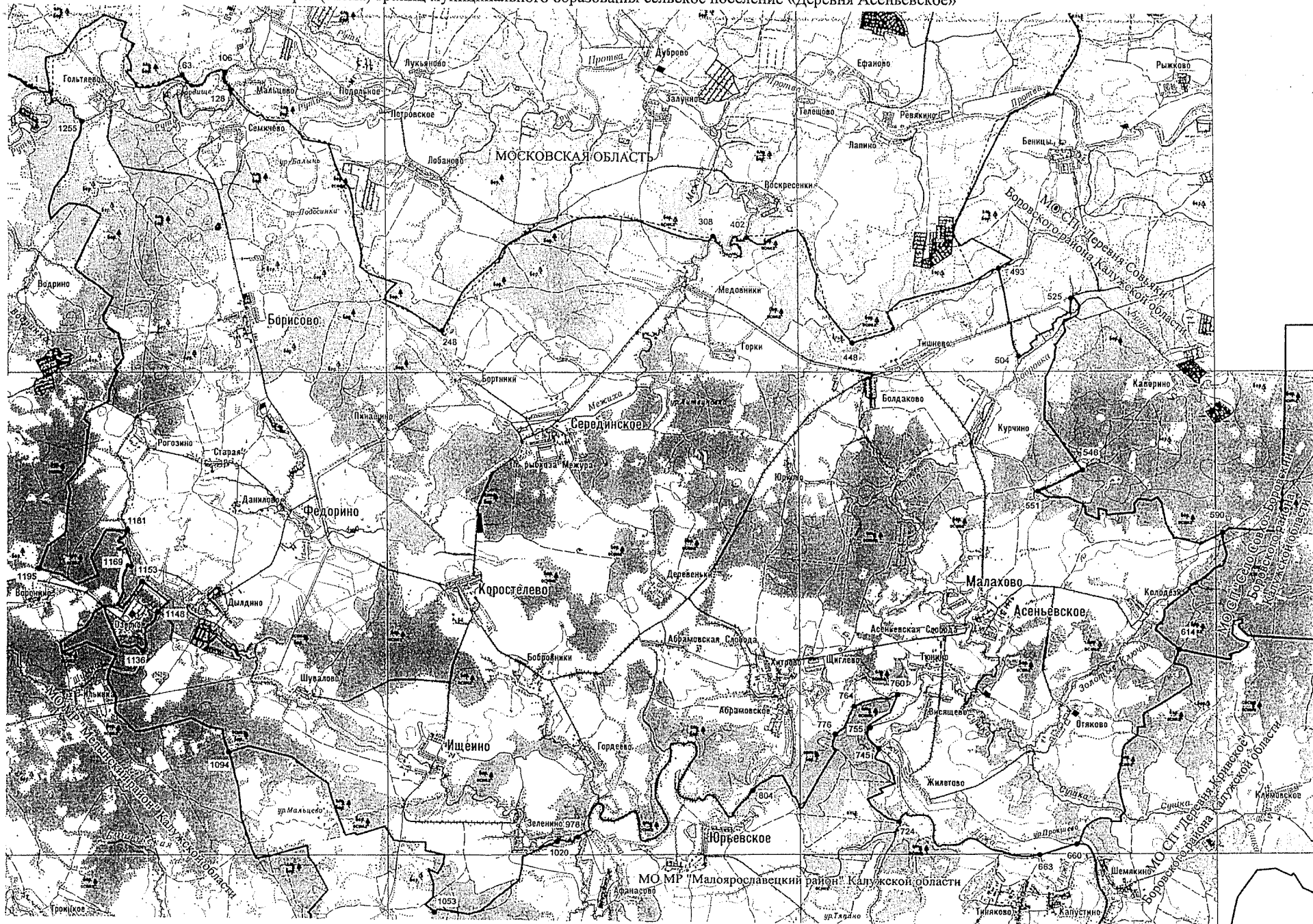
Карта (схема) границ муниципального образования сельское поселение «Деревня Асеньевское»