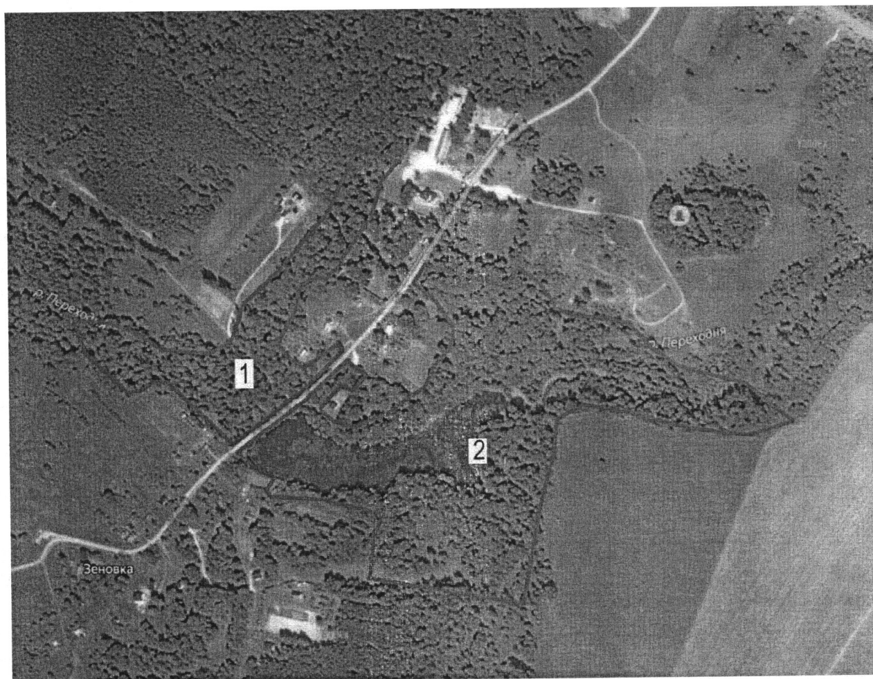
Границы особо охраняемой природной территории регионального значения – памятника природы «Усадьба «Шалово»