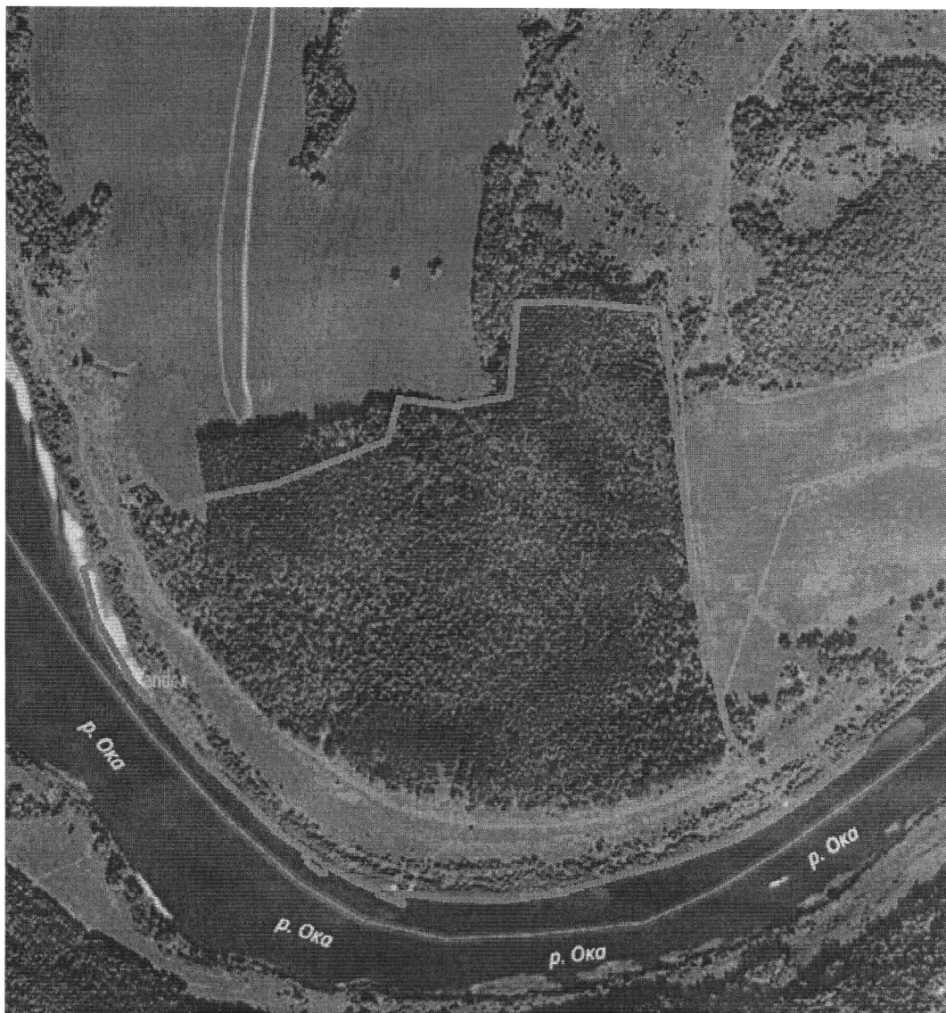
Границы особо охраняемой природной территории регионального значения – памятника природы «Лесной массив «Бор»