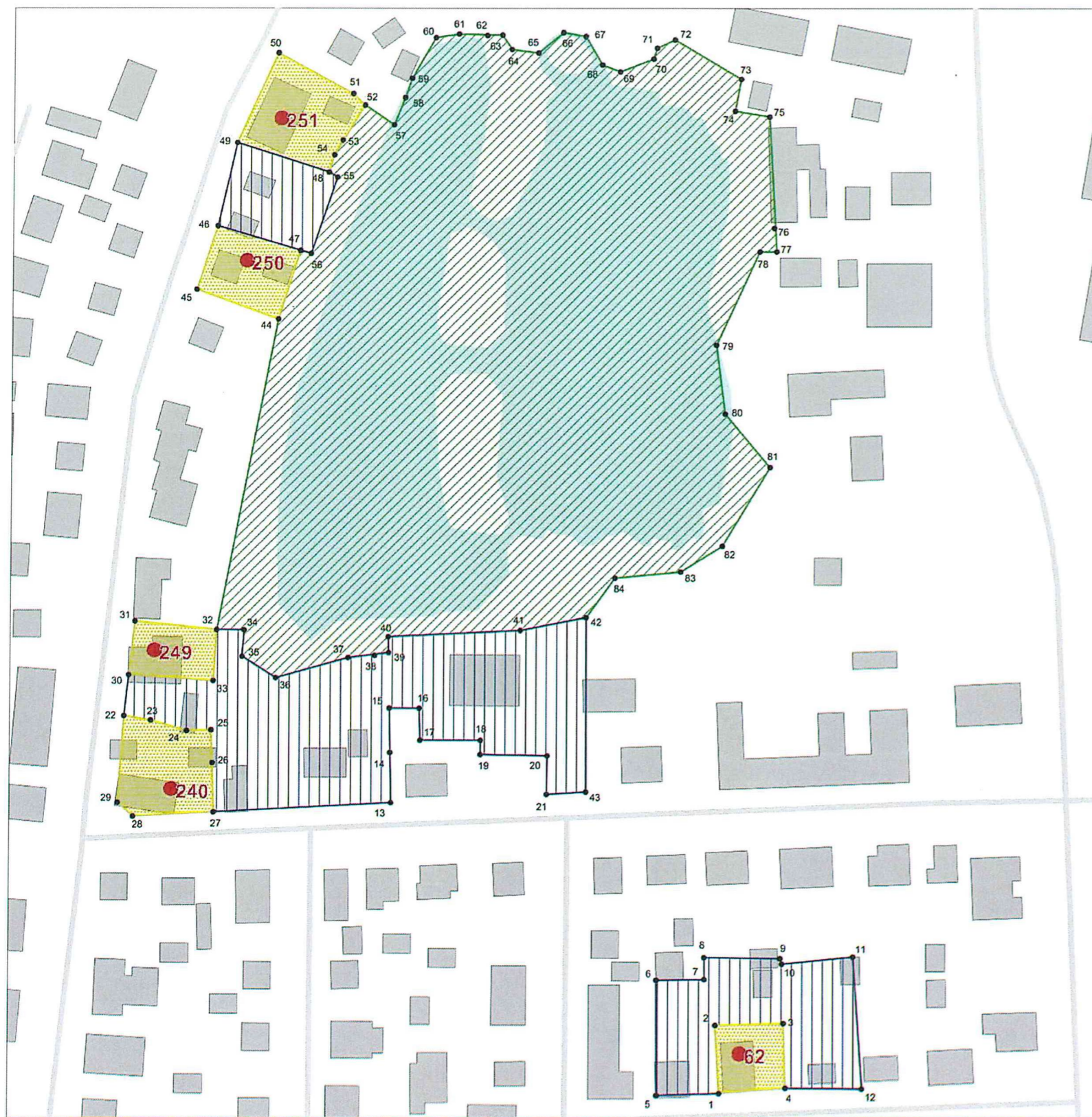
Схема № 16