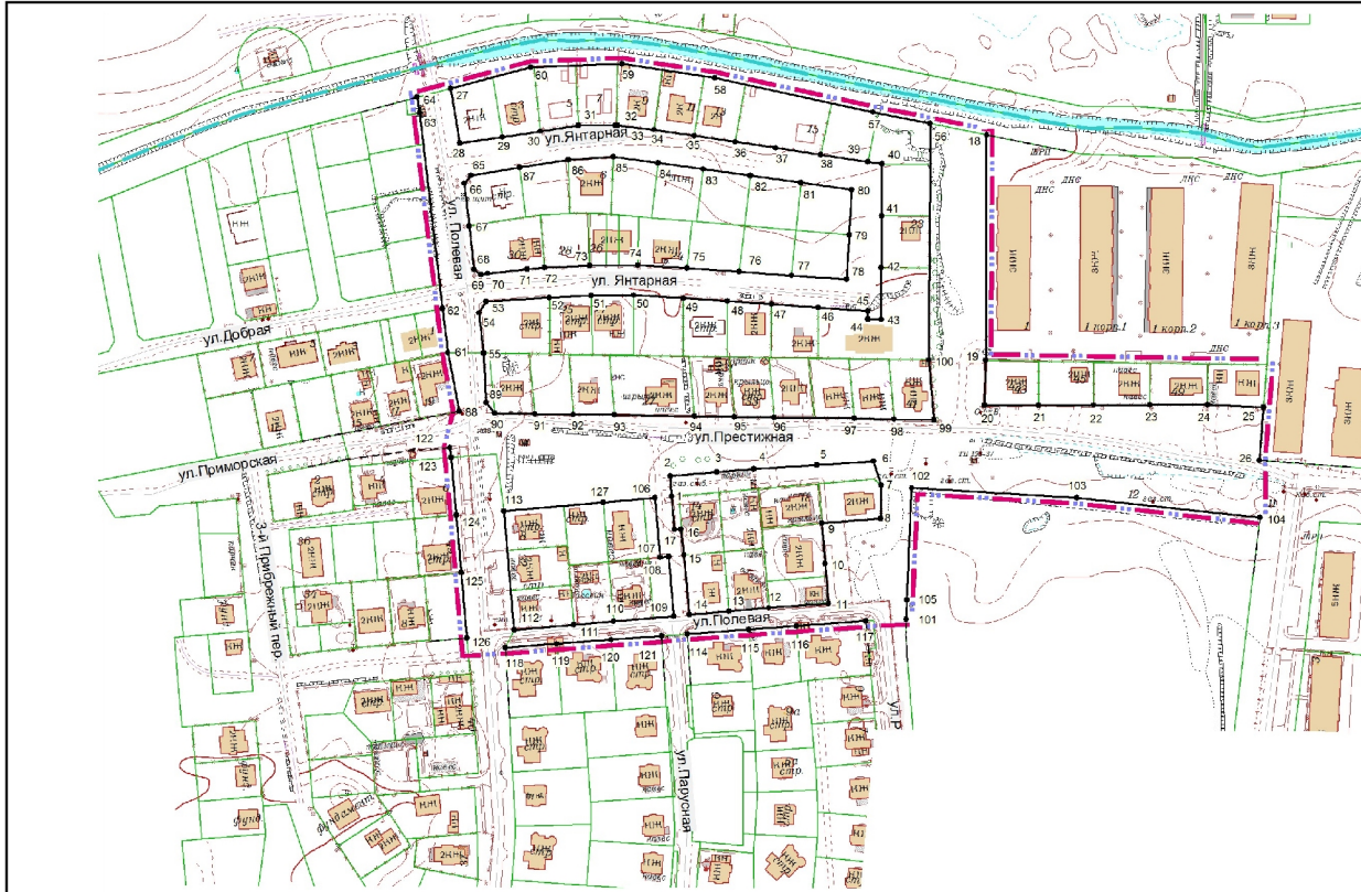
Перечень координат характерных точек красных линий