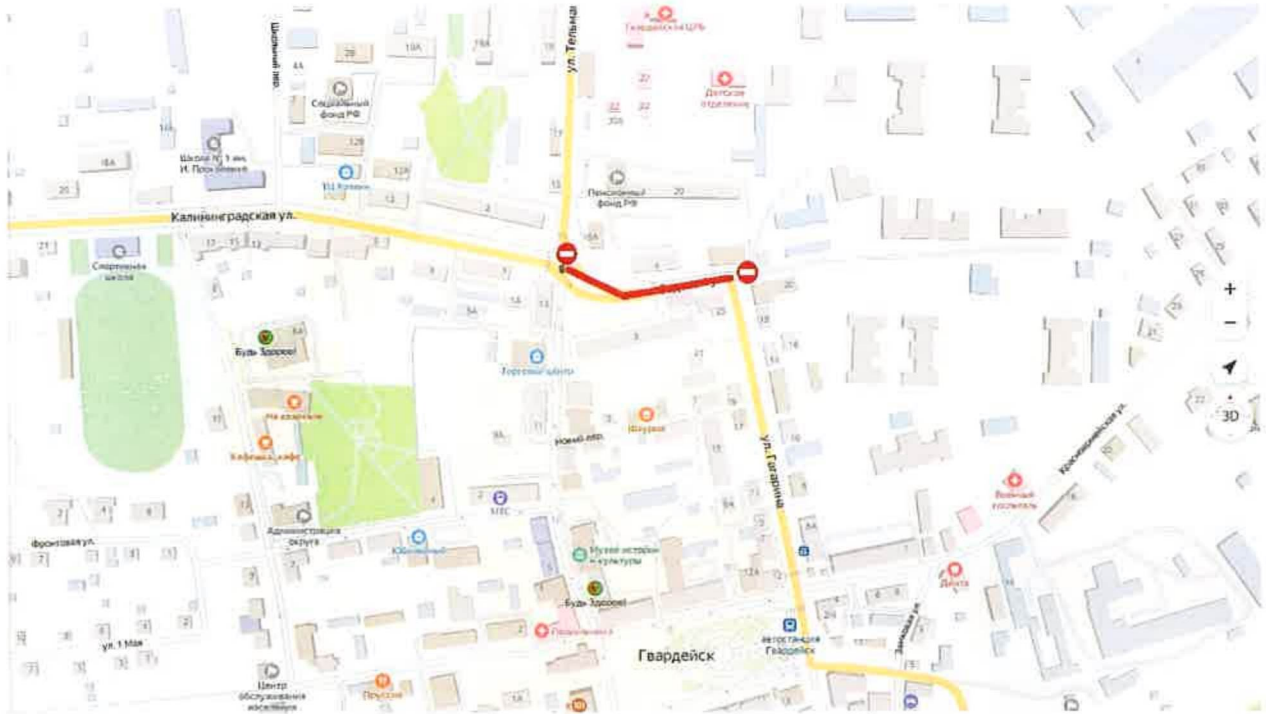
Схема движения общественного транспорта