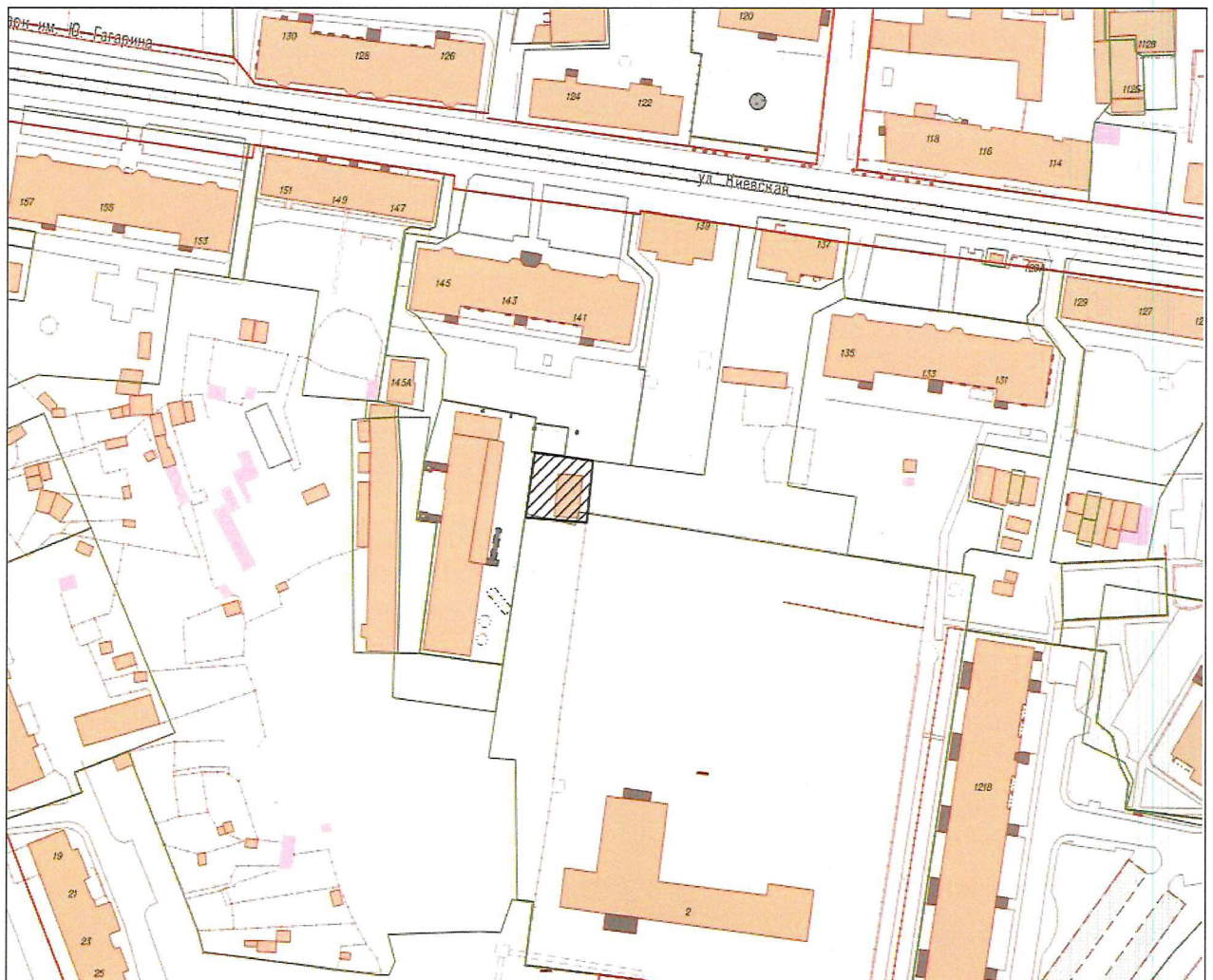
СХЕМА границ территории, в отношении которой отменяется отдельная часть документации по планировке территории, утвержденной постановлением администрации городского округа «Город Калининград» от 14 декабря 2016 года № 1892

Приложение к приказу Министерства градостроительной политики Калининградской области от « 17 » апреля 2023 года № 166