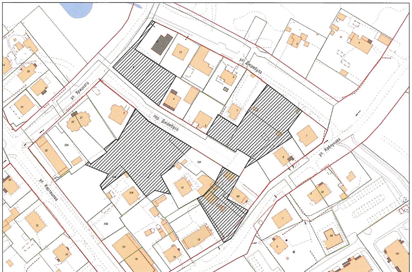
СХЕМА границ территории, в отношении которой отменяются отдельные части документации по планировке территории, утвержденной постановлением главы администрации городского округа «Город Калининград» от 28 мая 2009 года № 772

Приложение к приказу Министерства градостроительной политики Калининградской области от « 14 » апреля 2023 года № 165