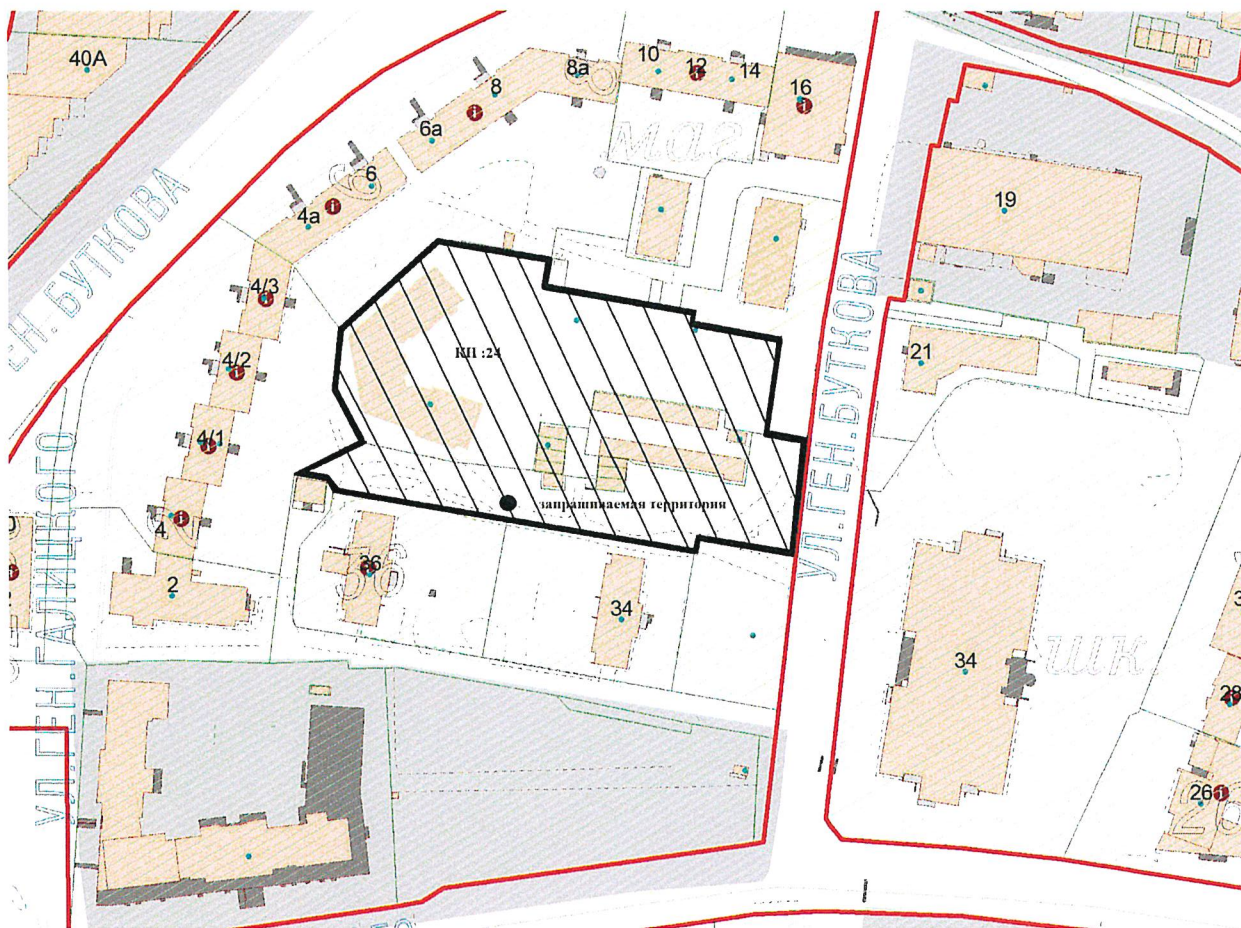
СХЕМА границ территории, в отношении к которой осуществляется подготовка проекта внесения изменений в проект межевания территории

Исполняющий обязанности руководителя (директора)