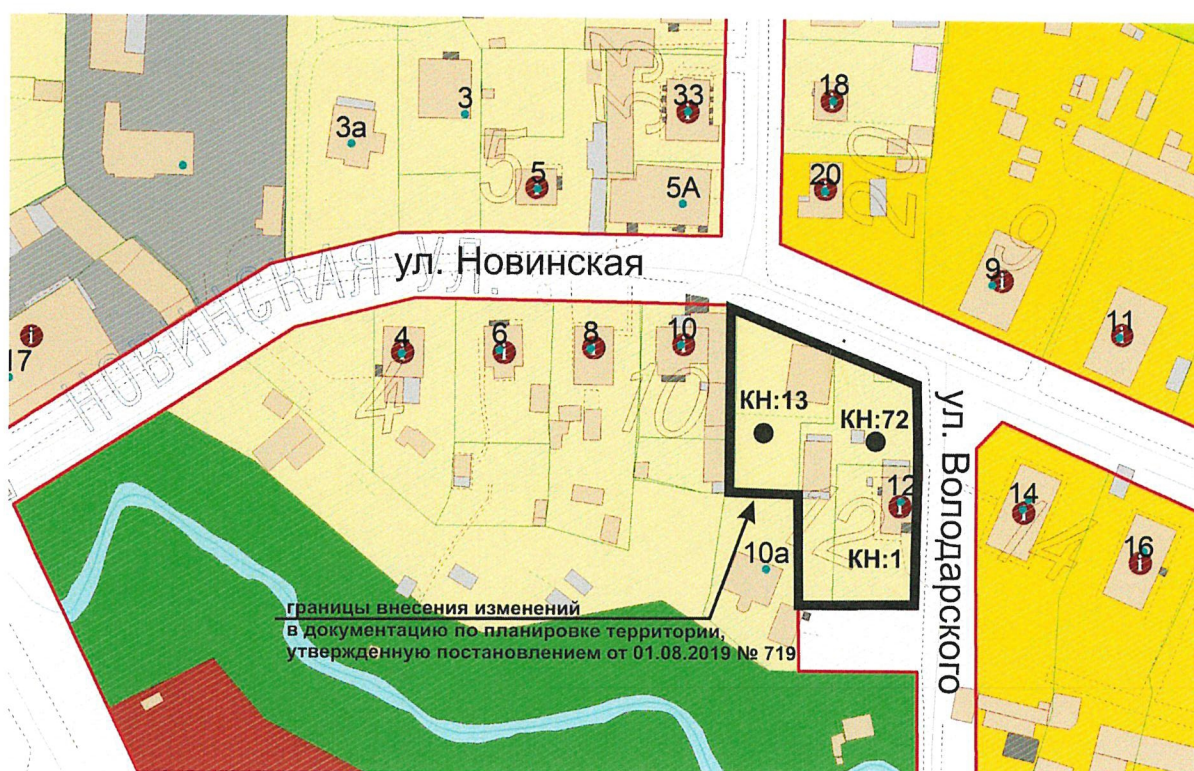
СХЕМА границ территории, в отношении к которой осуществляется подготовка проекта внесения изменений в проект межевания территории

Исполняющая обязанности руководителя (директора)