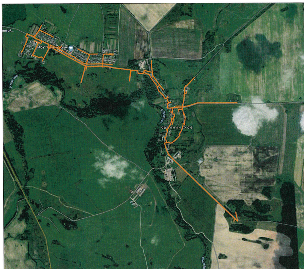
СХЕМА границ территории, в отношении к которой осуществляется подготовка документации по планировке территории