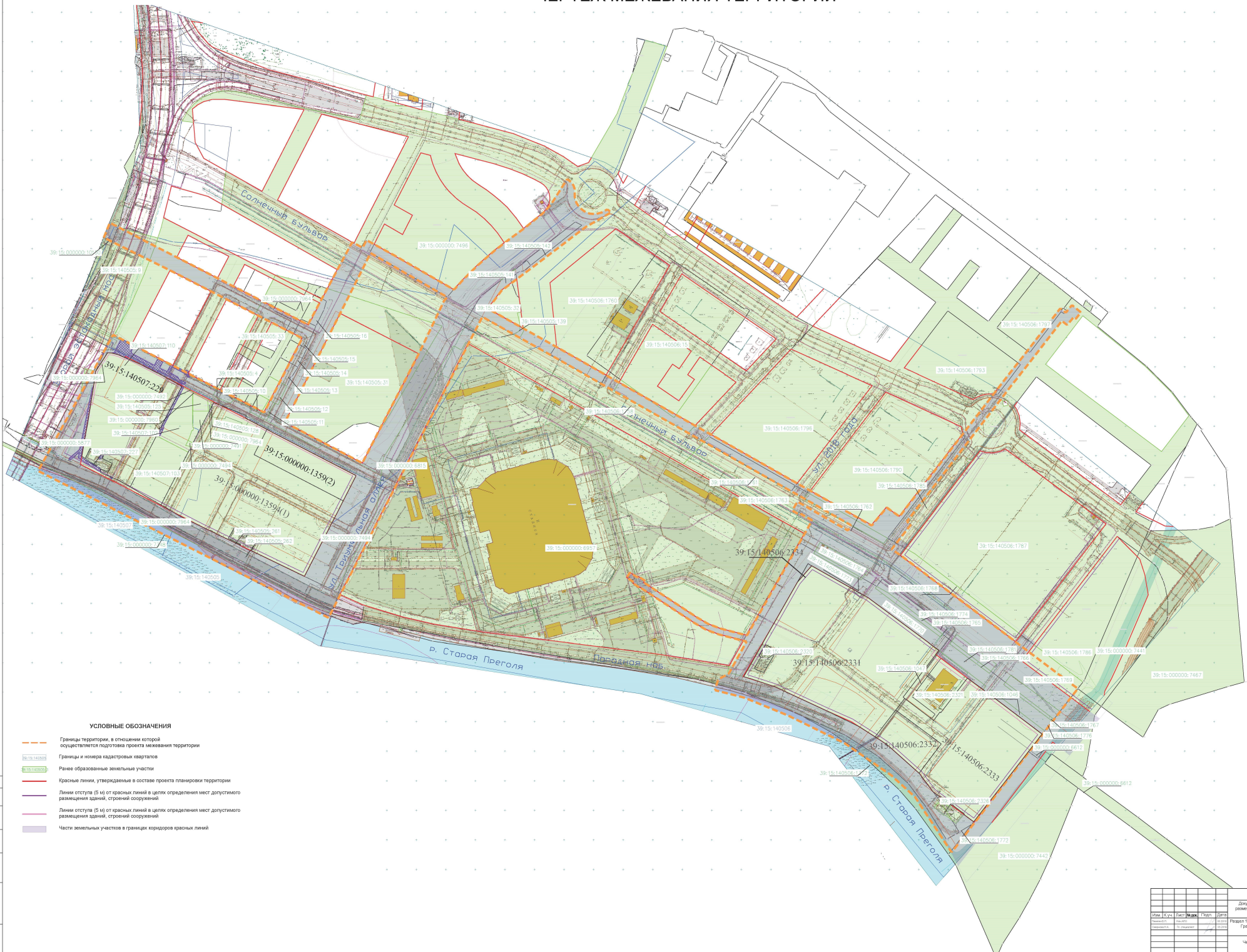
ЧЕРТЁЖ МЕЖЕВАНИЯ ТЕРРИТОРИИ