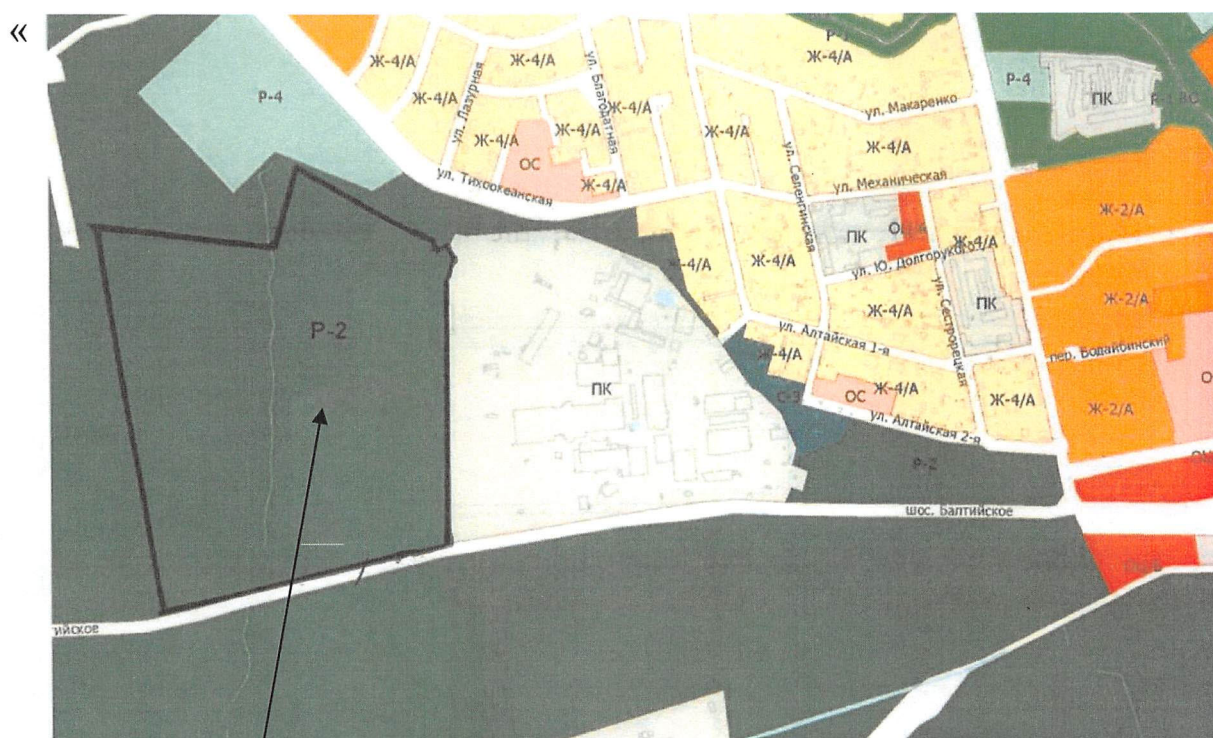
земельный участок с КН 39:15:110651:65

1. Графическое изображение приложения 1 «Карта градостроительного зонирования. Карта границ территориальных зон» применительно к части земельного участка с кадастровым номером 39:15:110651:65 изложить в следующей редакции: