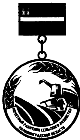
РИСУНОК нагрудного знака «Почетный работник сельского хозяйства Калининградской области»